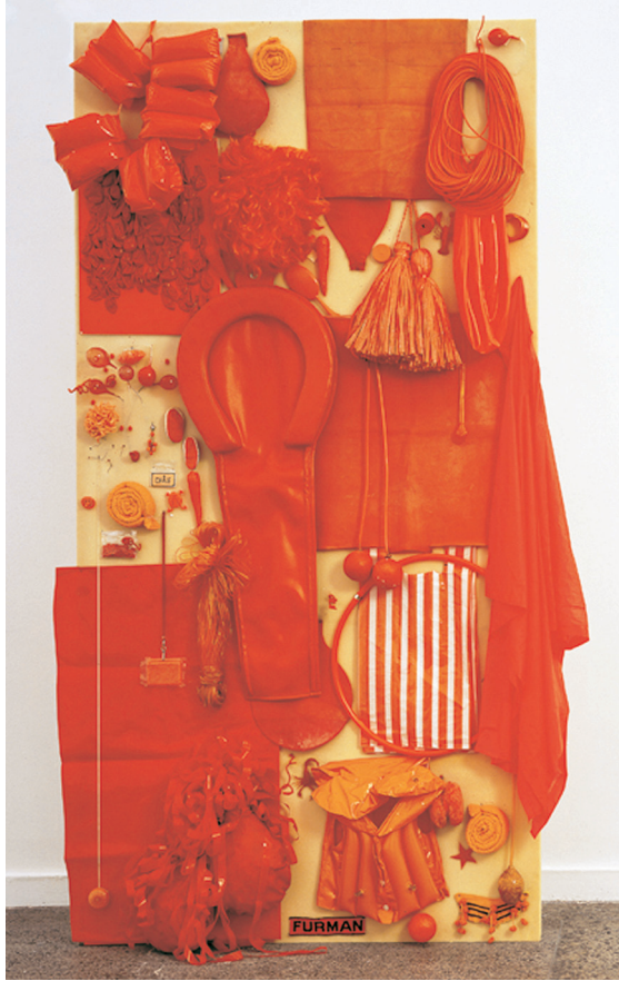
Exuberancia naranja I , 1995 Objetos de plástico y madera Cortesía de la artista y de Galerie Peter Kilchmann, Zürich