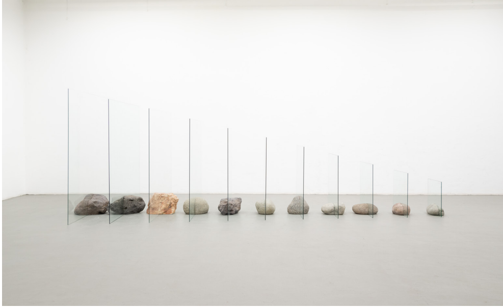
Es en nosotros donde los paisajes tienen paisaje, 2019 Vidrio y piedras de río