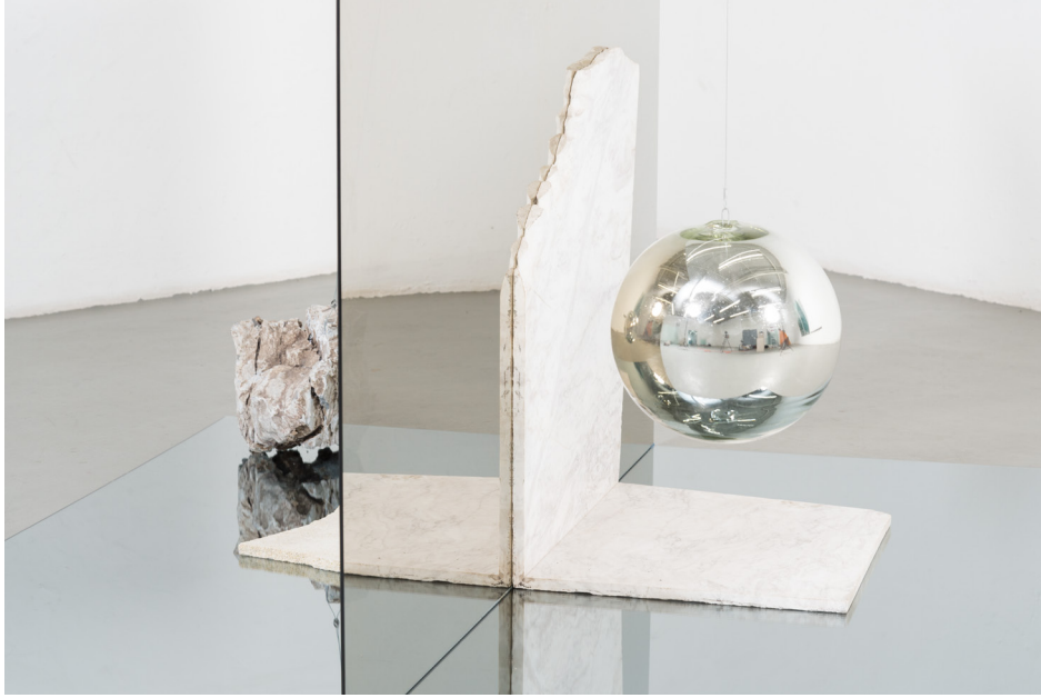
Paisaje metafísico , 2019 Vidrio espejo, mármol, roca, piedra de río, esfera de vidrio y cable de acero