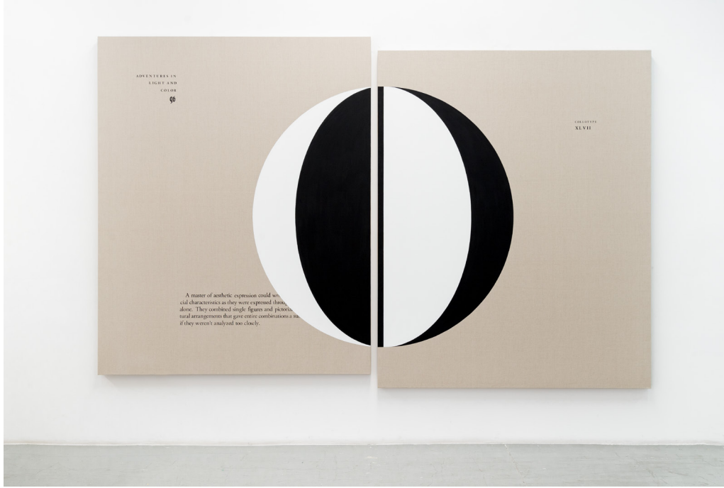
They Combined Single Figures, 2019 Serigrafía y pintura vinílica sobre lino crudo