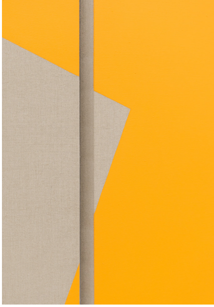
Memoria de una piedra , 2019. (Detalle) Pintura vinílica sobre lino crudo