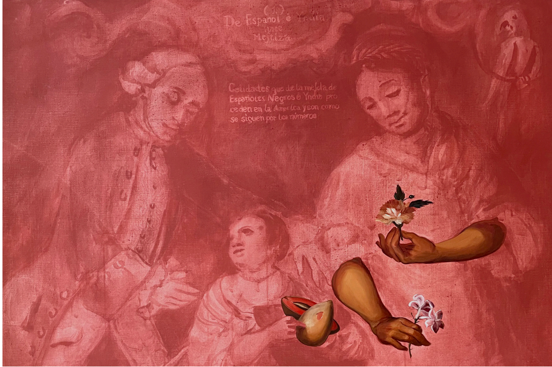
Sandra Gamarra Serie Querían brazos y llegamos personas , 2022 16 óleos sobre tela