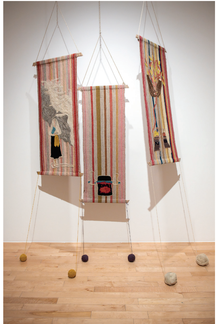
Túmitl Quiullatla / Temporada de lluvias , 2024 Instalación con audio Cortesía del colectivo

Quiullatla / Temporada de lluvias es una instalación que describe el proceso de estudio colectivo alrededor de la lana realizado por parte del equipo de trabajo Túmitl, compuesto por mujeres tejedoras y artistas, a lo largo de los últimos dos años en San José Cuacuila (Zacatlán, Puebla). En la sala se reproduce el círculo de sillas y bancos donde tuvieron lugar las conversaciones y prácticas del grupo, además se presentan textiles, diversos materiales, notas y objetos que atestiguan este proceso colectivo, el cual fue determinado también por la observación del entorno y el uso de plantas endémicas. Este aspecto es particularmente visible en la paleta cromática de los hilos y tejidos teñidos con vegetales recolectados durante la estación de lluvias. A la vez, en las obras textiles colgadas al techo se observan algunos dibujos realizados en afelpado que reconstruyen el trabajo alrededor de la producción de la lana, mientras que en el audio, que reporta algunas palabras en náhuatl y en las notas en papel montadas sobre la pared, se encuentran ideas y palabras que han apuntalado este aprendizaje común.