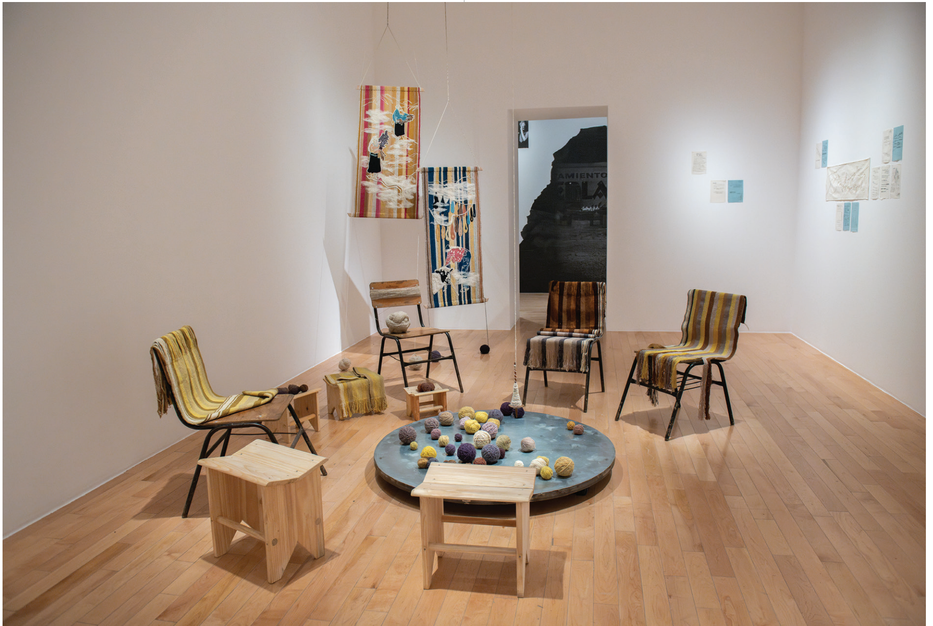
Túmiti Quiullatla / Temporada de llluvias , 2024 Instalación con audio Cortesía del colectivo