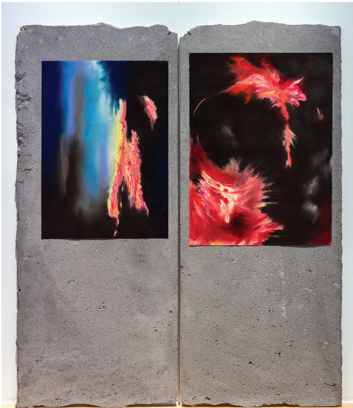
Katya Mora Fuerzas que no son paisaje , 2024 Videoinstalación