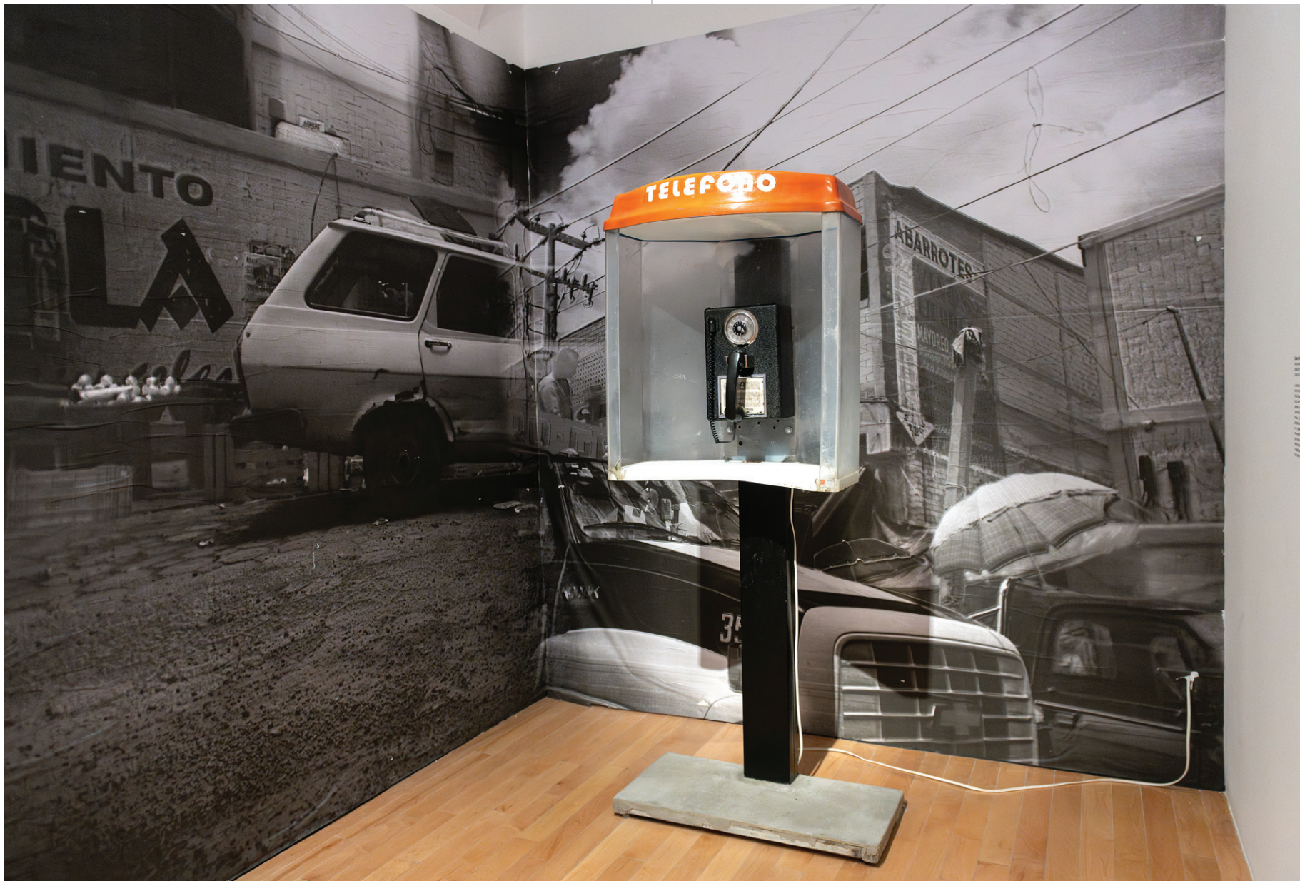
Claudia Castelán Paisaje sensible de la memoria , 2024 Instalación, fotografía, audio y video