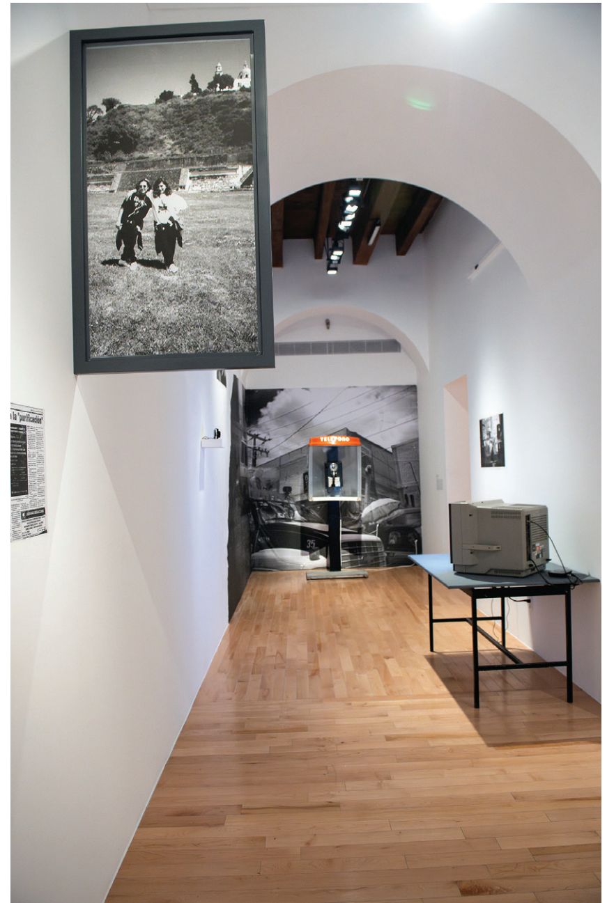
Claudia Castelán Paisaje sensible de la memoria , 2024 Instalación, fotografía, audio y video

La instalación Paisaje sensible de la memoria reconstruye las interacciones entre la escena musical underground en la época predigital y el espacio público del área urbana Puebla-Cholula, concentrándose particularmente en la reescritura y reapropiación de la ciudad producida por los eventos de escucha colectiva. Además de presentar varios materiales de un fondo documental de la época reunido por la artista y algunos colaboradores, la pieza se articula a través de las palabras de periodistas radiofónicas, músicas y DJ activas en los noventa y primera década del presente siglo, cuya participación en estos movimientos ha sido, en su momento, invisibilizada. En la cabina y en los walkman , es posible escuchar audios que recolectan sus testimonios. Estas narraciones cercanas e íntimas, expuestas en dispositivos consonantes con el tiempo al cual se hace referencia, reflexionan, no sólo sobre el legado de la música alternativa y la individualización de la escucha en la época digital, también sobre la violencia de género, la expresión de una voz propia y la relación cambiante entre mujeres y ciudad a lo largo de los últimos treinta años.