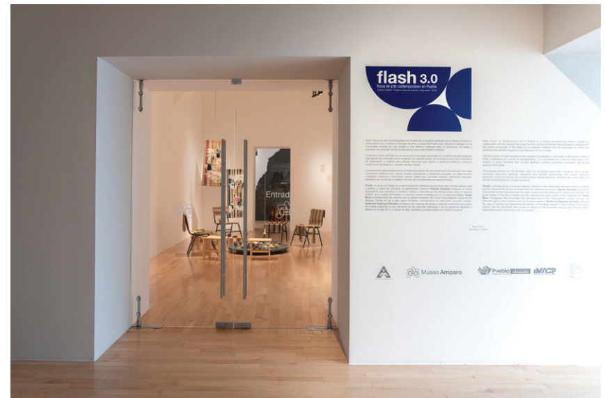
Vista de sala