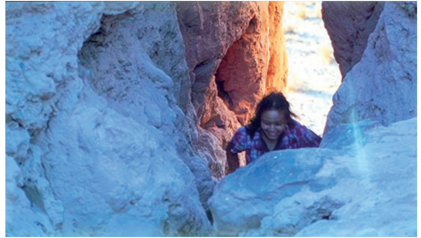
Saodat Ismailova Chillpiq 2016 Video monocal, color, sonido estéreo 17'

La película comienza con dos autobuses que cruzan el horizonte y se dirigen hacia el cementerio redondo de Chillpiq. La cámara les sigue mientras un grupo de cuarenta mujeres jóvenes escalan las ruinas del antiguo emplazamiento zoroastriano que en su día albergó el asta de la bandera de la República Autónoma de Karakalpakstán durante la era soviética. Tras el colapso de la URSS, estas estructuras metálicas fueron transformadas por las mujeres locales en símbolos de fertilidad, ya que se asemejan al arquetipo del árbol de la vida en la antigua cultura turca y siberiana. Chillpiq captura la devoción de las mujeres por el asta de la bandera y su interacción con este objeto recién sagrado, destacando el sincretismo moderno en la intersección del zoroastrismo, el chamanismo, el islam y la Unión Soviética. Mientras tanto, muchos lugares de veneración preislámicos en Asia Central se enfrentan hoy en día a una destrucción generalizada. En gran parte de su obra, Ismailova explora las tradiciones orales transmitidas por las mujeres entre sus madres y abuelas. En la formación de su comprensión del tiempo, su abuela le enseñó “que somos responsables de las siete generaciones que nos preceden y de las siete que vendrán después”. Existe una sinergia con Meltd in the Sun , expuesta en la galería anterior, ya que la primera toma de esa obra se filmó en el mismo lugar.