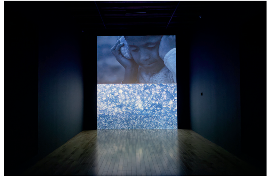
Saodat Ismailova Two Horizons 2017 Video HD de dos canales, color, sonido 4.1 24'