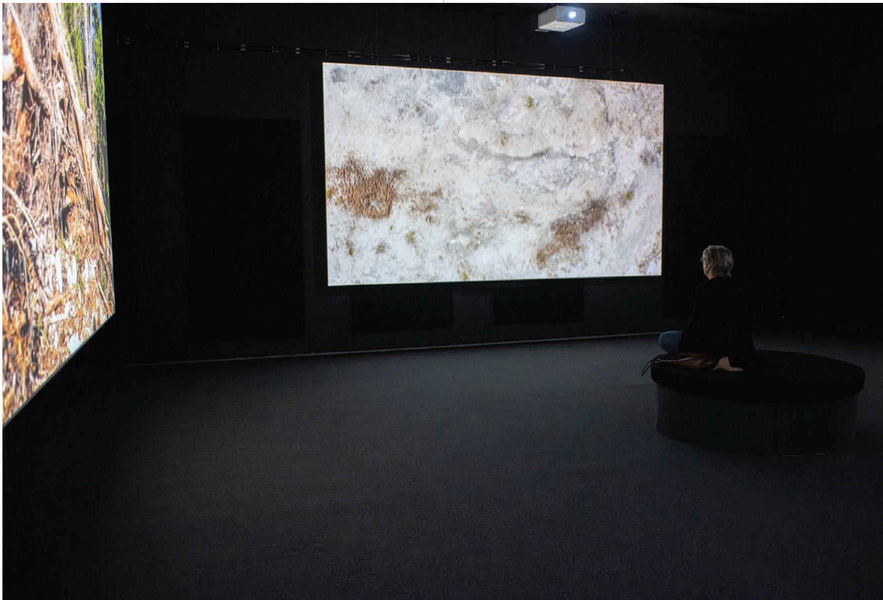
Vista de sala