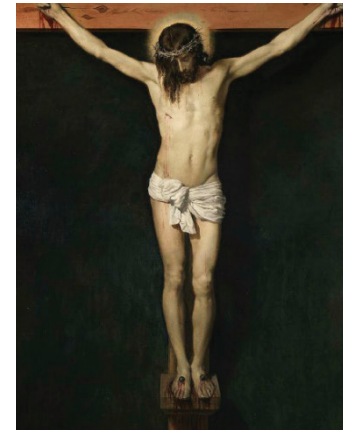
Diego Rodríguez de Silva y Velázquez Cristo crucificado , 1632 Óleo sobre lienzo Museo Nacional del Prado, Madrid, España