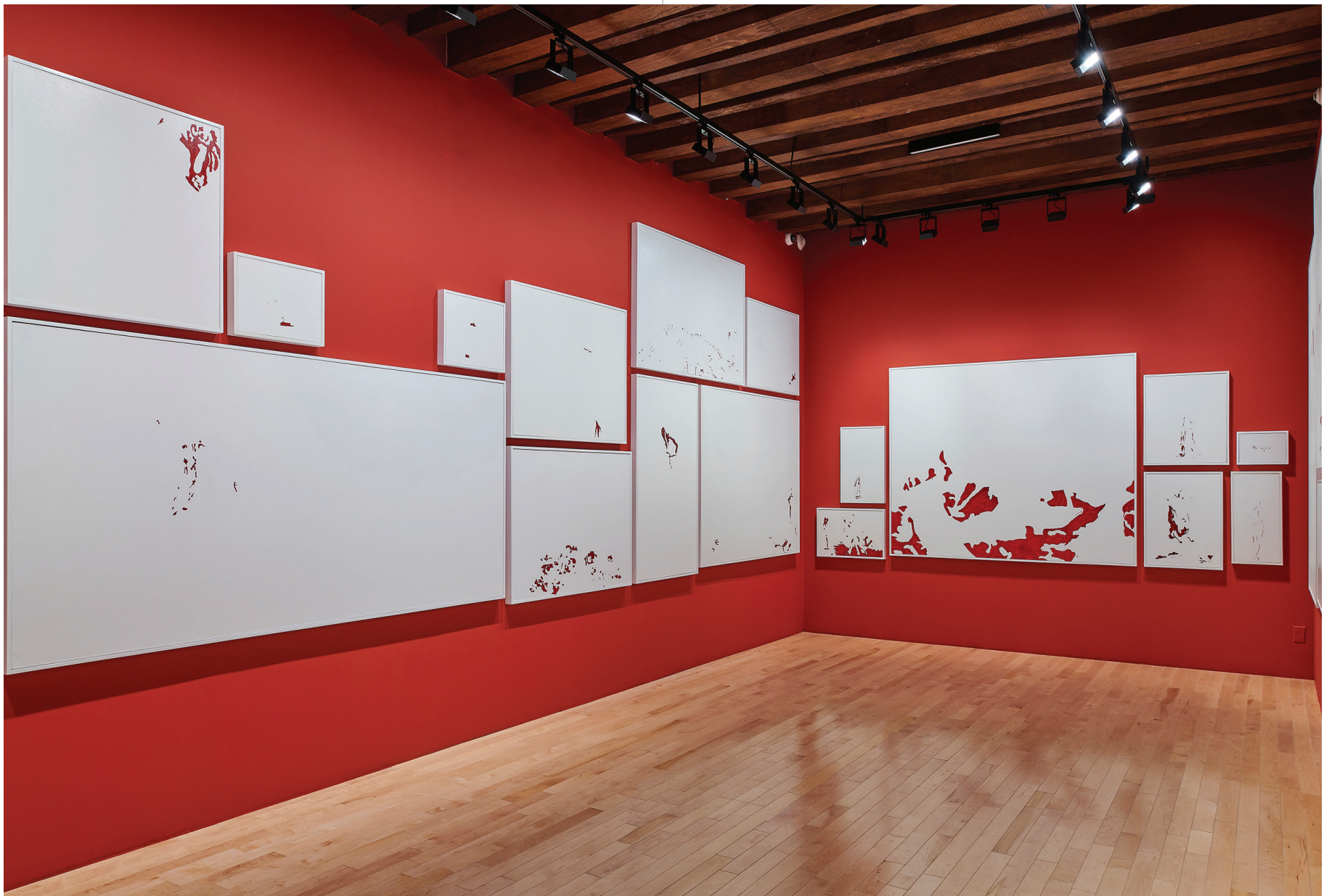
Vista de sala