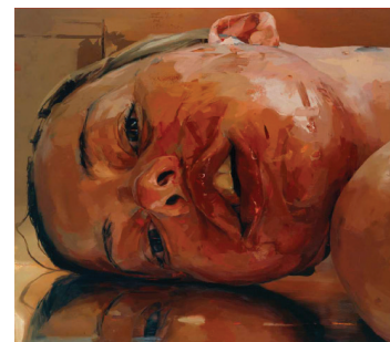
Jenny Saville Reverse (Reverso) , 2002-2003 Óleo sobre lienzo Colección privada