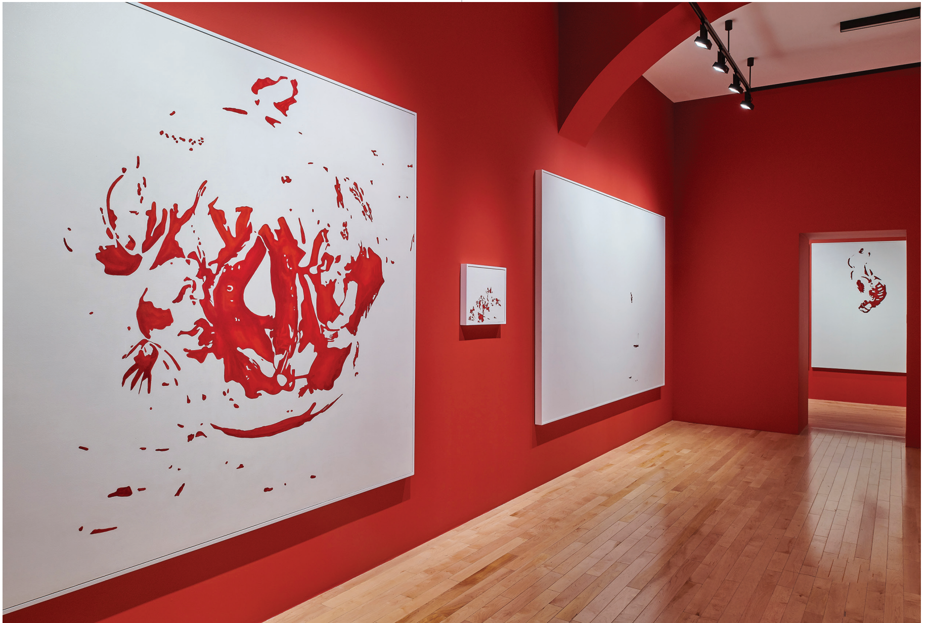
Vista de sala