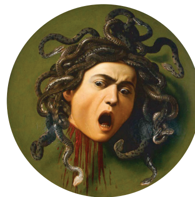
Michelangelo Merisi da Caravaggio La cabeza de Medusa , 1597 Óleo sobre lienzo Galería Uffizi, Florencia, Italia