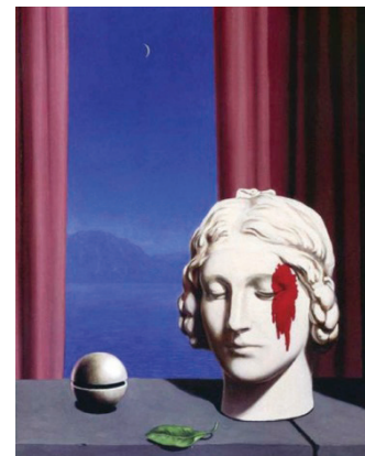
René Magritte The Memory (La memoria) , 1948 Óleo sobre lienzo Propiedad de la Comunidad Francesa de Bélgica