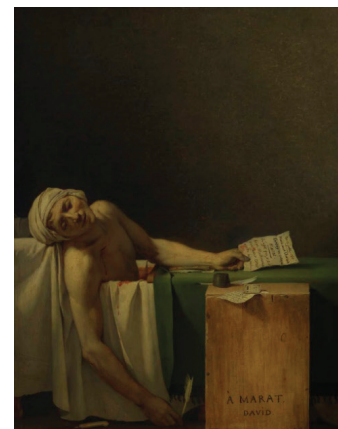
Jacques-Louis David La muerte de Marat , 1793 Óleo sobre lienzo Museo Oldmasters, Bruselas, Bélgica