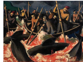
Sámal Joensen-Mikines Grindadráp (Cazadores de ballenas) , 1942 Óleo sobre lienzo Museo de Arte de Vejle, Dinamarca