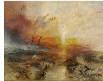
J. M. W. Turner The Slave Ship (El barco de esclavos) , 1840 Óleo sobre lienzo Museo de Bellas Artes, Boston, Estados Unidos