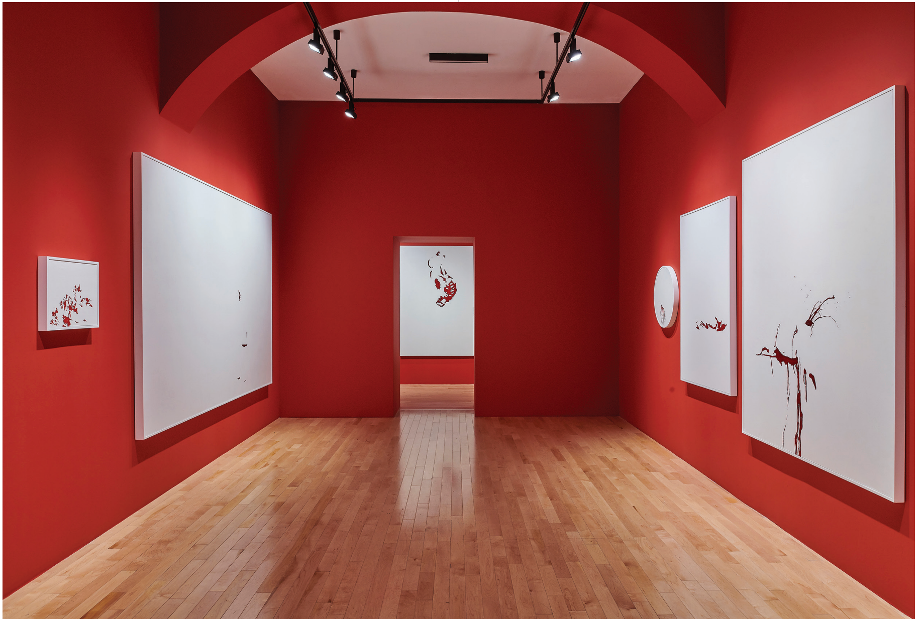
Vista de sala