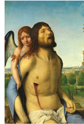
Antonello da Messina Cristo muerto sostenido por un ángel , 1475-1476 Técnica mixta sobre tabla Museo Nacional del Prado, Madrid, España