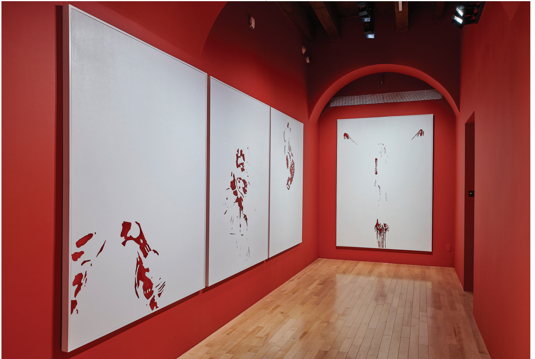
Vista de sala