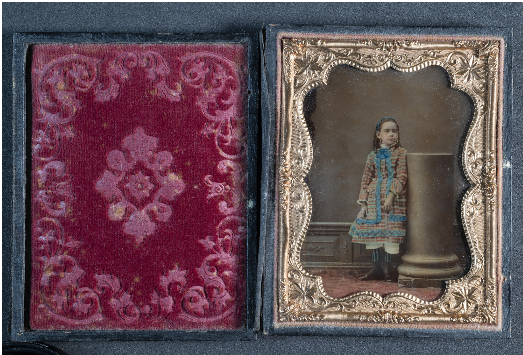
Anónimo Retrato de niña, ca. 1870-1880 Albúmina coloreada pegada al vidrio