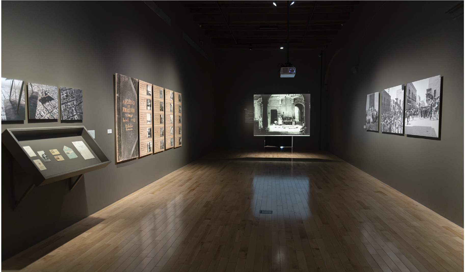
Vista de sala

Tres autores asociados al Club Fotográfico —Mariano Tagle, Guillermo Robles Callejo y R. Sarmiento— van más allá de la práctica de aficionado para explorar la fotografía documental y la construcción teatral de la imagen. Influidos por el cine mudo de la época, exploran la autorrepresentación y la seriación narrativa de las imágenes.