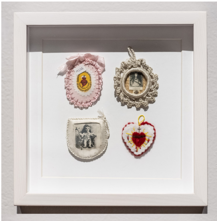
Exvoto Sagrado Corazón de Jesús, s. f. Exvoto Niño Jesús, s. f. Exvoto J. M. María de Jesús, Religiosa Concepcionista, s. f. Exvoto Sagrado Corazón de Jesús, s. f. Fotografías bordadas

Las pinturas devocionales y los iconos religiosos eran objetos únicos y preciados, producidos en series muy limitadas. Requerían de artistas cualificados, pigmentos costosos y largos tiempos de producción. En el siglo XIX, primero las tecnologías de reproducción como la litografía y, más tarde, la fotografía, permitieron la producción de “imágenes sagradas” baratas e infinitamente reproducibles.