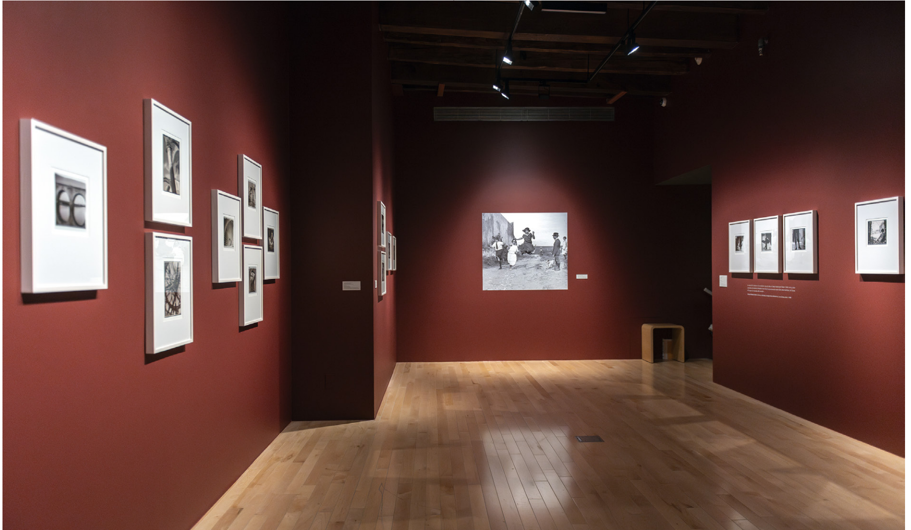
Vista de sala

Si hay un autor paradigmático de la fotografía poblana del siglo XX, este es Juan Crisóstomo Méndez. Conocido por sus tomas de arquitectura y eróticas, así como por sus composiciones formales y constructivas, Méndez merece ser considerado uno de los autores más relevantes de la vanguardia fotográfica mexicana.