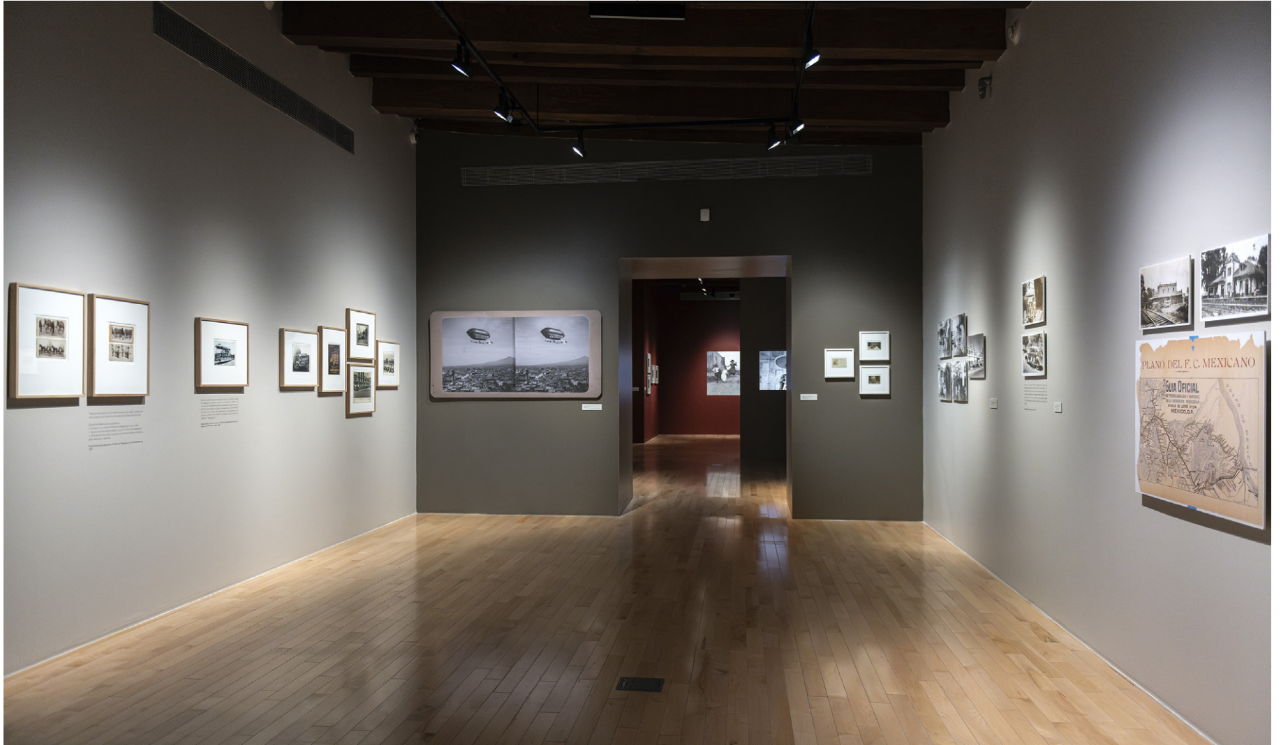
Vista de sala

A lo largo del siglo XIX y principios del XX, los transportes incrementan su velocidad y producen un colapso del tiempo y el espacio. La fotografía poblana se vuelve instantánea y móvil en las producciones de los miembros del Club Fotográfico de Puebla: aparece el cine como medio e imagen referencial de la modernidad industrial.