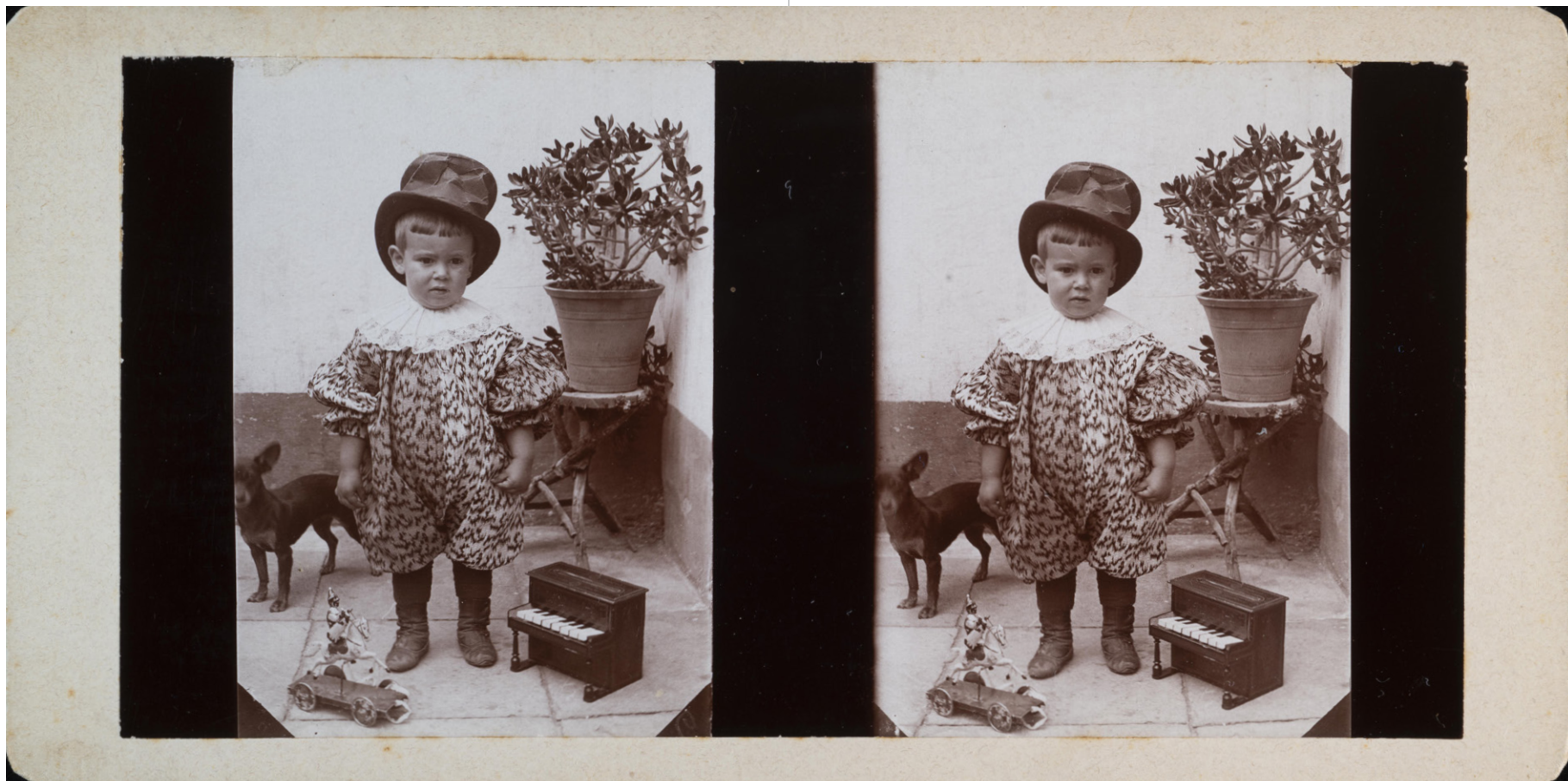
Mariano Tagle Calderón Fotos de familia , 1911 Tarjetas estereoscópicas