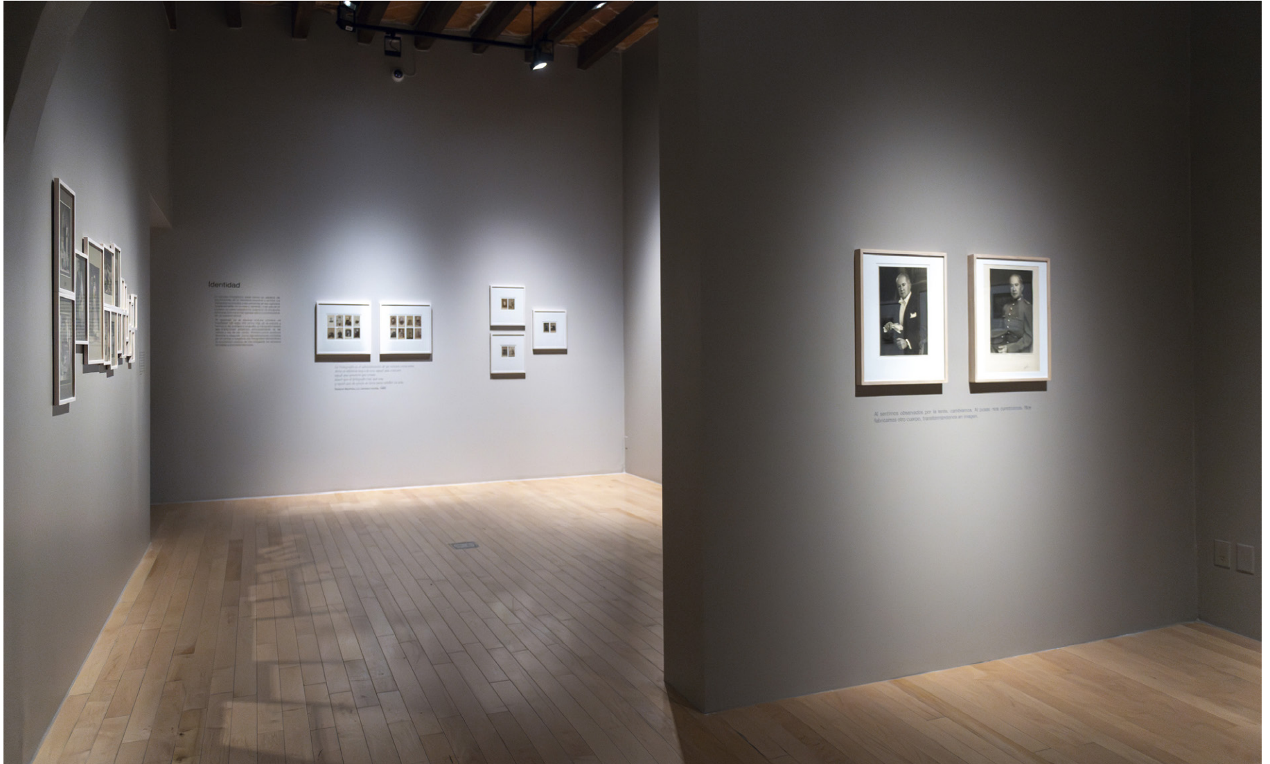
Vista de sala

El estudio fotográfico sirve como un espacio de construcción de la identidad personal y familiar. La fotografía acompaña a las personas en los tránsitos fundamentales de la vida y, también, más allá de la muerte: en tanto plataforma colectiva, la fotografía funciona como una red que las ubica y contextualiza en un espacio social.