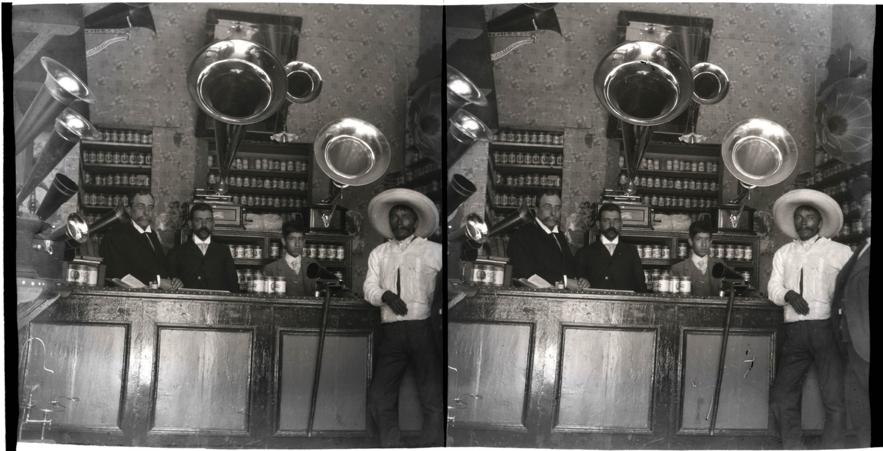
Mariano Tagle Calderón Tienda de fonógrafos, ca. 1905 Albúmina