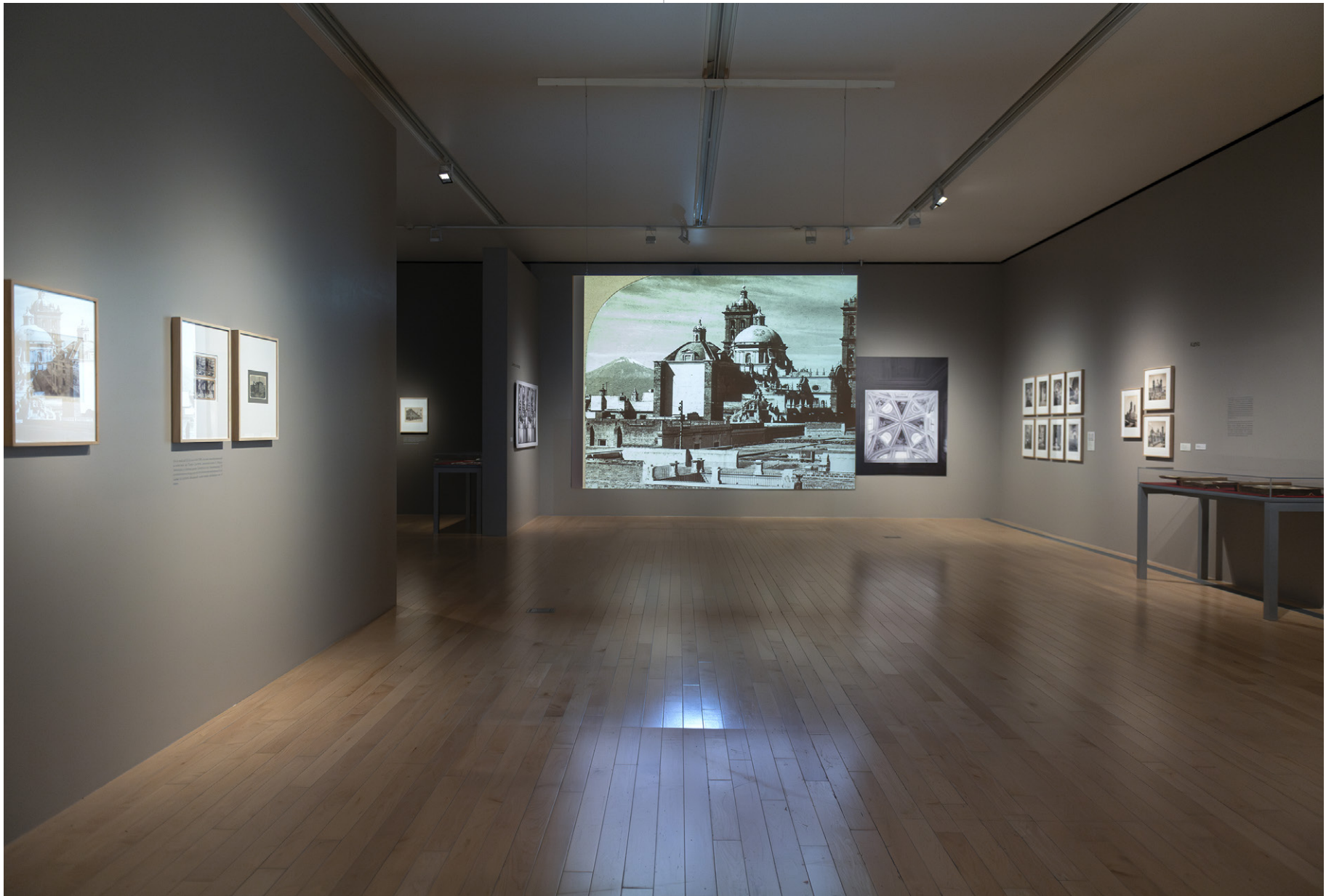
Vista de sala