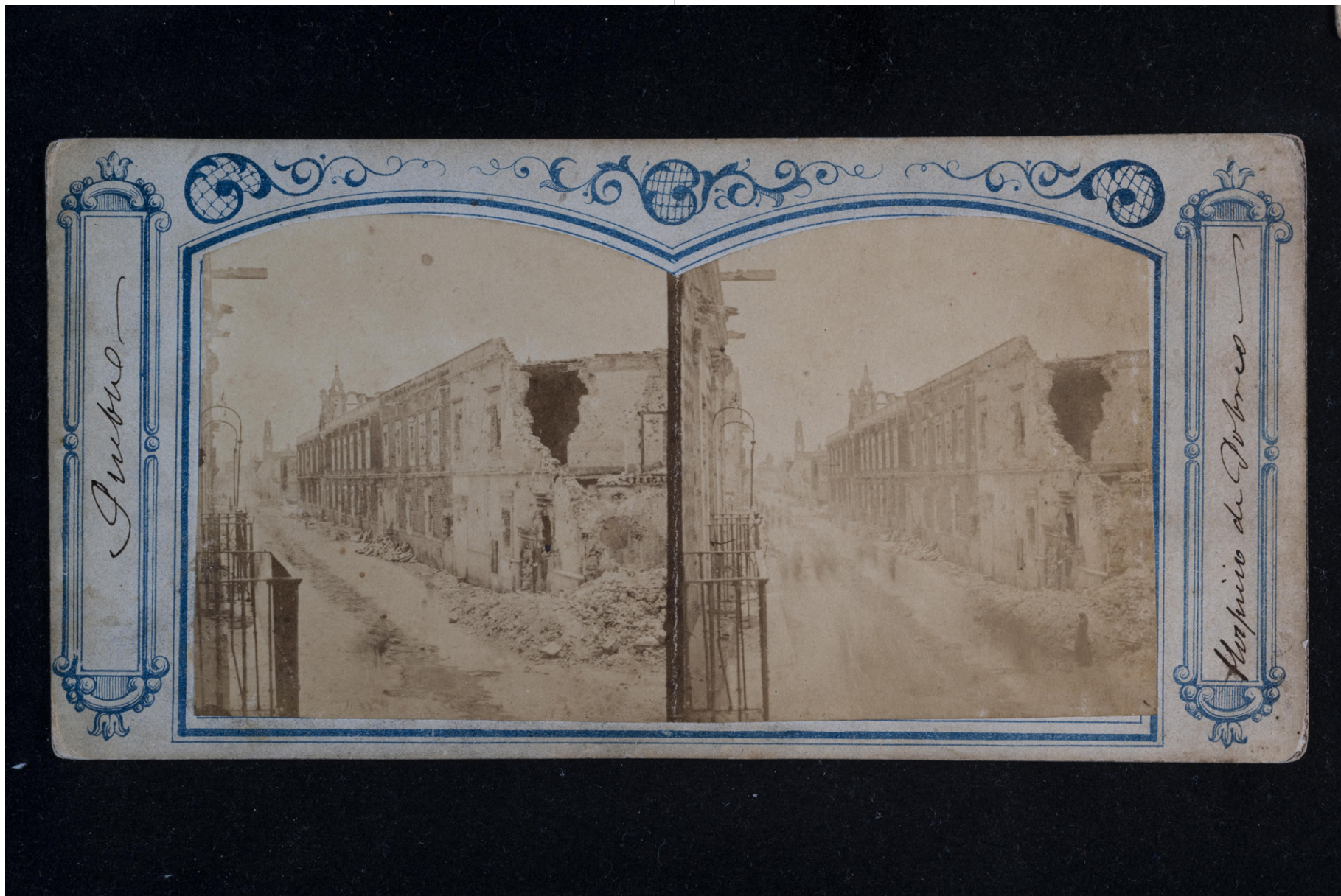
Hospicio de Pobres, ca. 1863-1864 Albúmina