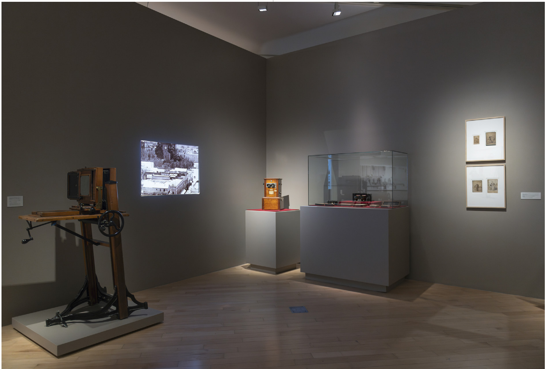
Vista de sala