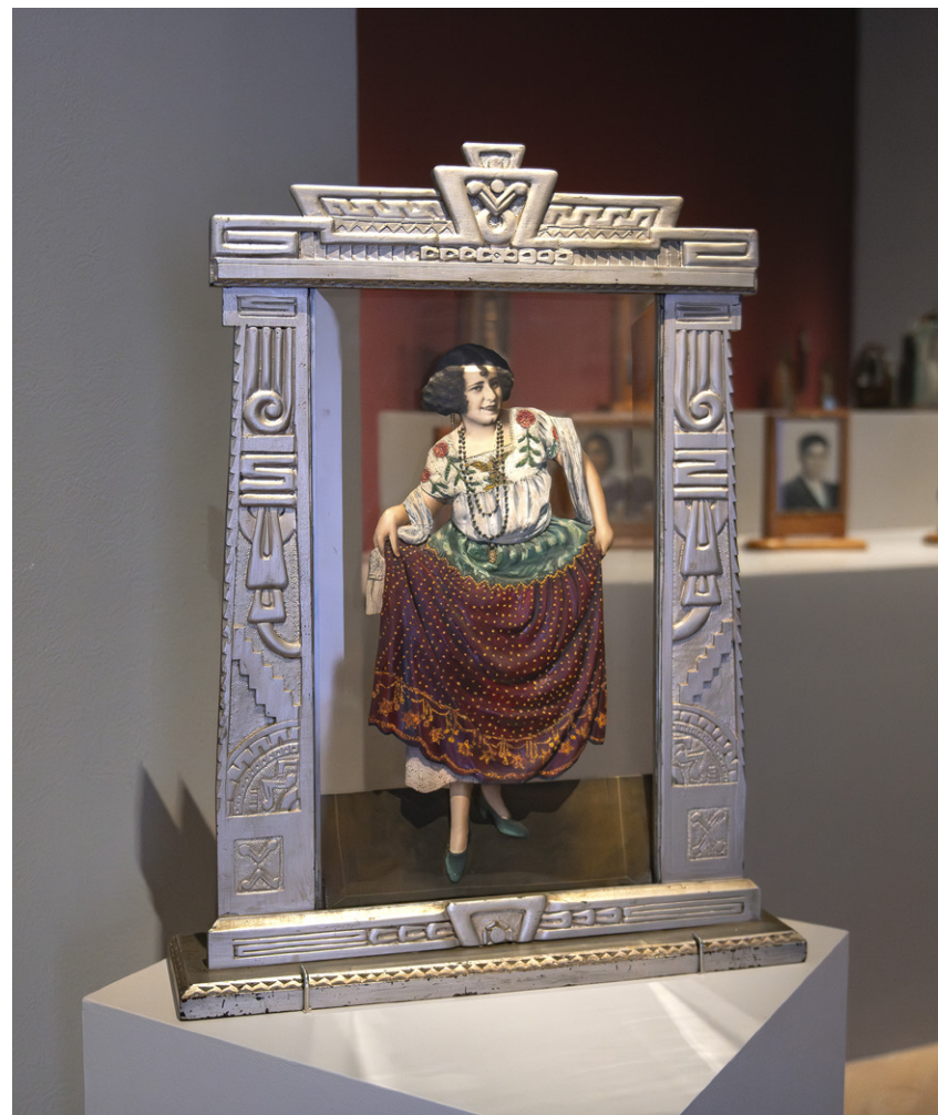
China Poblana , ca. 1930 Fotoescultura

Asociadas con las fotografías coloreadas del siglo XIX, a partir de la tercera década del siglo XX aparecen las fotoesculturas, piezas producidas en el estudio y destinadas al espacio doméstico de las clases medias y populares. Relacionadas con el culto devocional y con la memoria familiar, estas piezas se tallaban en cedro rojo, para luego encolarse sobre ellas una fotografía en papel flexible que se coloreaba con óleo.