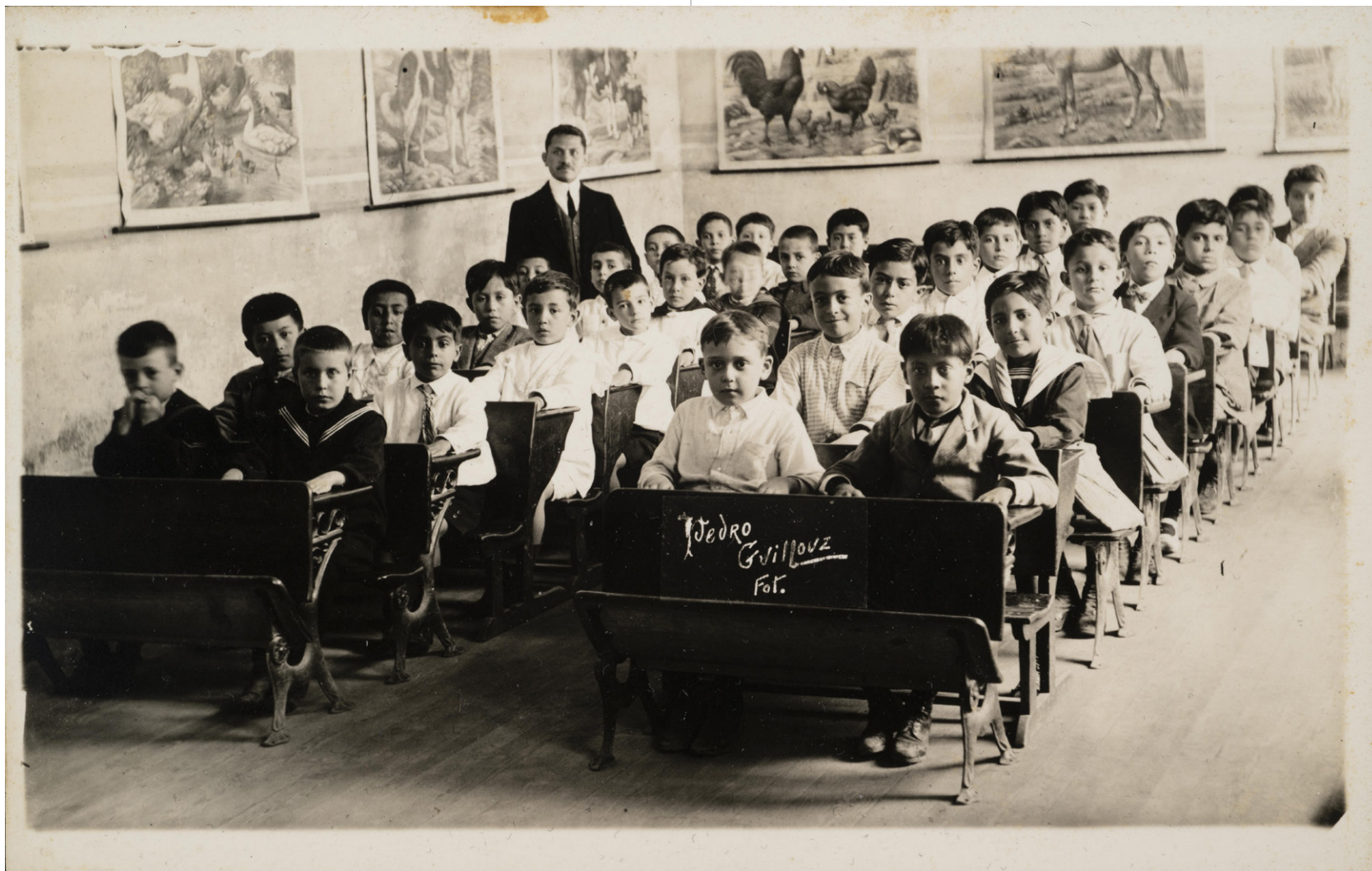
Pedro Guillouz Aula de escuela para niños, s. f. Fototeca Lorenzo Becerril. Lilia Martínez y Torres