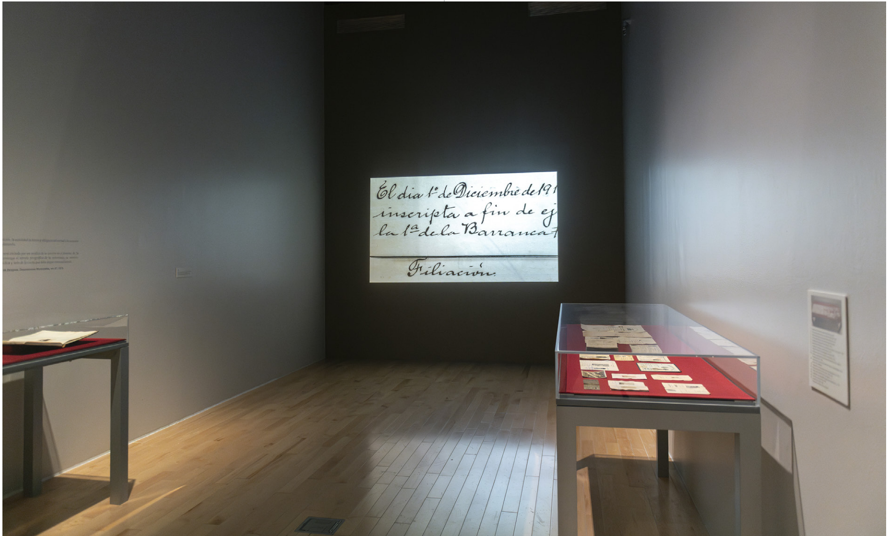
Vista de sala

Al desplazarse del ámbito privado al público, la fotografía adquiere el poder de unificar a las personas según una tipología o filiación determinada. De ahí el poder regulador y de control de la fotografía utilizada como archivo social.