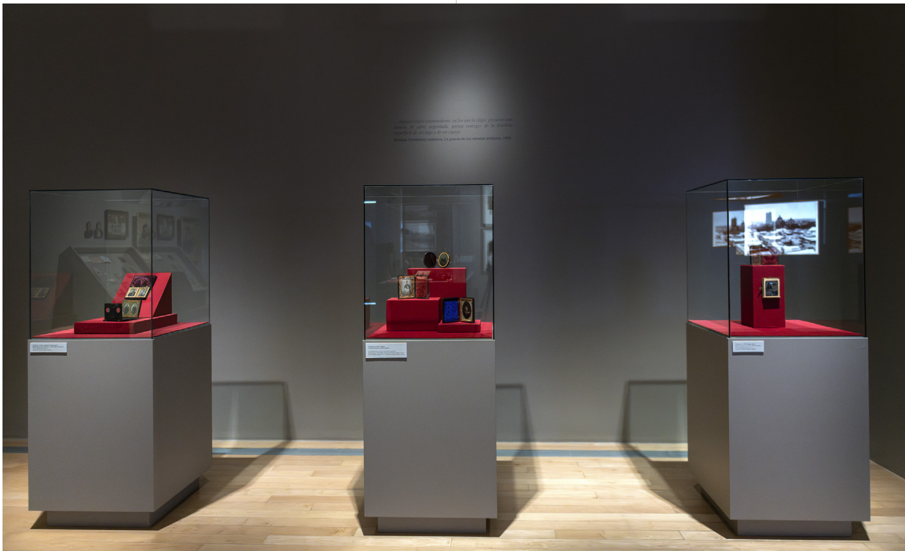
Vista de sala

El daguerrotipo (placa de cobre plateada), el ambrotipo (colodión sobre vidrio con fondo oscuro) y el ferrotipo (colodión sobre metal lacado) eran técnicas fotográficas positivas directas: no utilizaban negativo y producían un único ejemplar de la imagen, que solía guardarse en un estuche. Objetos irrepetibles, de pequeño formato y gran detalle, estas fotografías en positivo directo se asociaron, en las primeras décadas de la fotografía, con las miniaturas pintadas.