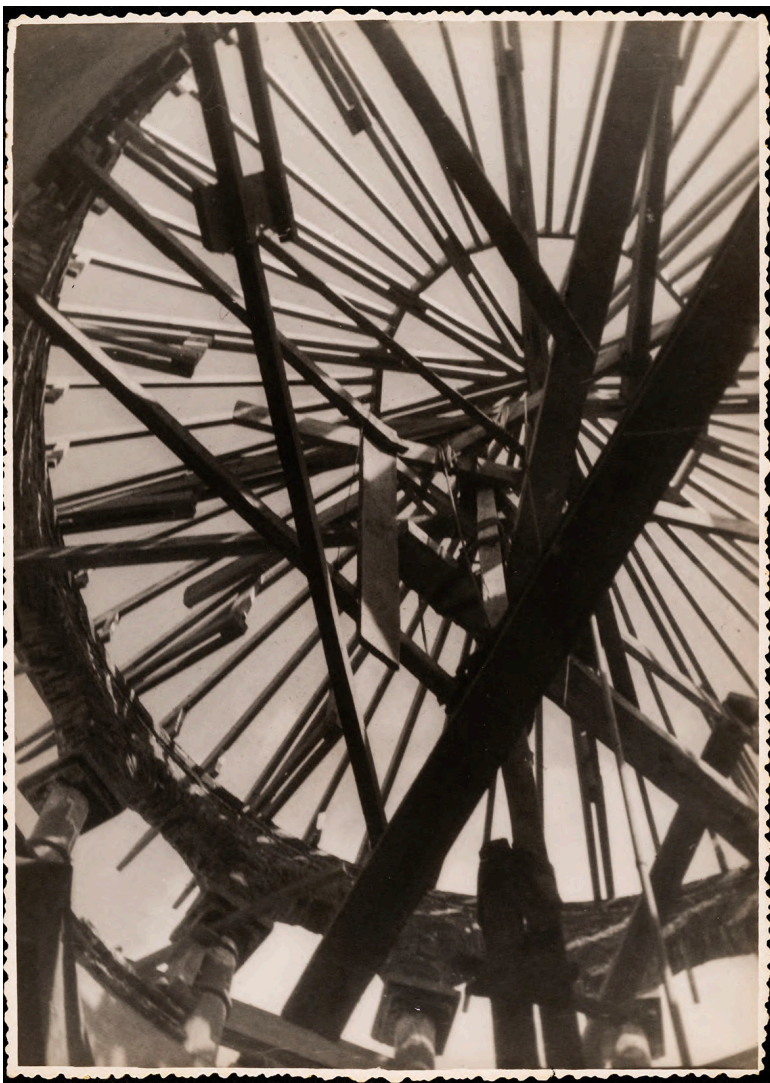
Juan Crisóstomo Méndez Geometrías Reproducción digital Colección Fototeca Juan Crisóstomo Méndez, Museos Puebla, Gobierno del Estado de Puebla

Más allá de los extraordinarios desnudos suyos publicados por Ava Vargas en La casa de cita. En el barrio galante (1991), Juan Crisóstomo Méndez (1885-1962) fue, probablemente, el fotógrafo poblano más importante de la primera mitad del siglo XX. Pese a que no trabajó como profesional de la lente, su obra cubre, con una insólita y versátil capacidad estética, una vasta gama de géneros incluida la fotografía arquitectónica e industrial, el retrato, el paisaje, la naturaleza muerta y, por supuesto, el desnudo. Realizadas mediante cámaras de formato medio o estereoscópicas, sus imágenes se insertan perfectamente en la cultura visual de la instantaneidad y serialidad de inicios del siglo XX.