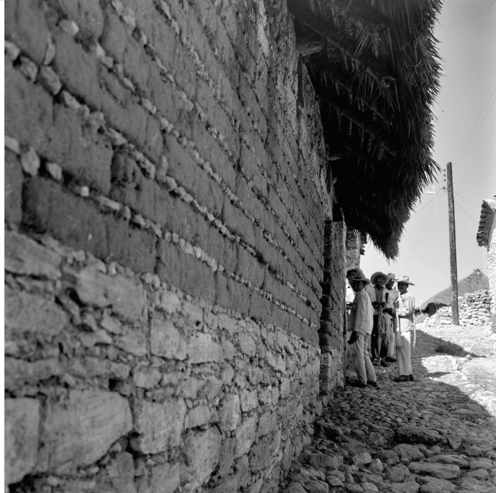
Ruth D. Lechuga Hombres en una calle empedrada Hombres en la comunidad nahua de Zitlala. La imagen, rica por el retrato logrado, también muestra la forma de construcción de la comunidad. Guerrero 1970 Digitalización de negativo monocromático plata-gelatina 120 mm

En la búsqueda de voz para sus imágenes, Ruth D. Lechuga exploró la luz, las formas, las texturas y las composiciones que le brindaban los diferentes escenarios que visitó, así como los rostros, los cuerpos, las danzas, las circunstancias y el trabajo cotidiano de mujeres, hombres, niñas y niños en cientos de comunidades mexicanas y algunos países del sur americano. Su interés estético la llevó a participar en el Club Fotográfico de México, a liderar el Grupo La Ventana y a colaborar con la Sociedad Fotográfica Almeriense de España. Por otro lado, su pasión documental dio como origen un vasto conjunto de hojas de contacto en las que anotó años, culturas indígenas, nombres de danzas, pueblos, artesanas, artesanos retratados por su cámara. Su fotografía no es de una sola aproximación. Su lenguaje visual se integra de bellas composiciones, pero sobre todo, del asombro que provocó en ella la diversidad natural, étnica, arquitectónica, arqueológica, artística, ritual y festiva de México.