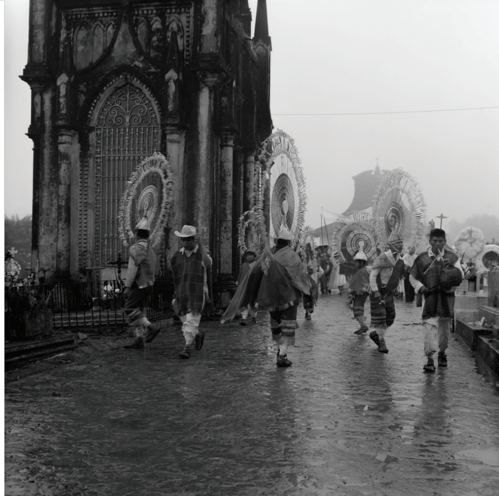
Ruth D. Lechuga Danza de los Quetzales Danza de los Quetzales en el cementerio de Cuetzalan en la Sierra Norte de Puebla. Los danzantes visten trajes rojos decorados con flecos dorados y capas, además portan atractivos tocados que recuerdan los rayos del sol. Puebla 1976 Digitalización de negativo monocromático plata-gelatina 120 mm

El registro fotográfico del estado es un mosaico de su riqueza natural y diversidad cultural: paisajes de Tehuacán y la Sierra Negra, arquitectura y vida cotidiana de la Sierra Norte, el Carnaval de Huejotzingo, fiestas y danzas, retratos de artesanas y artesanos del textil, chaquira, pirotecnia, papel picado, cerámica –como el destacado alfarero Herón Martínez de Acatlán de Osorio–, así como el amplio registro de la producción de papel amate y su uso ritual en San Pablito, Pahuatlán.