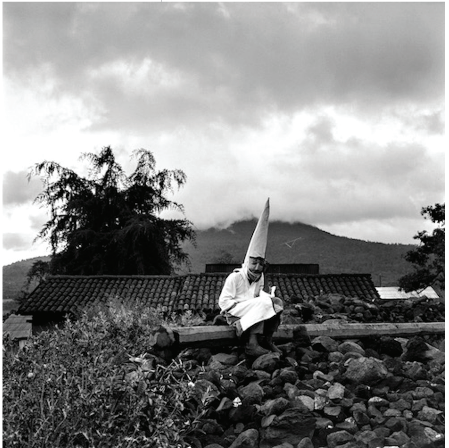
Ruth D. Lechuga Ermitaño de pastorela Ermitaño de pastorela en un paisaje de Ocumicho, este personaje es parte de las pastorelas de fin de año en la comunidad purépecha. Michoacán 1973 Digitalización de negativo monocromático plata-gelatina 120 mm