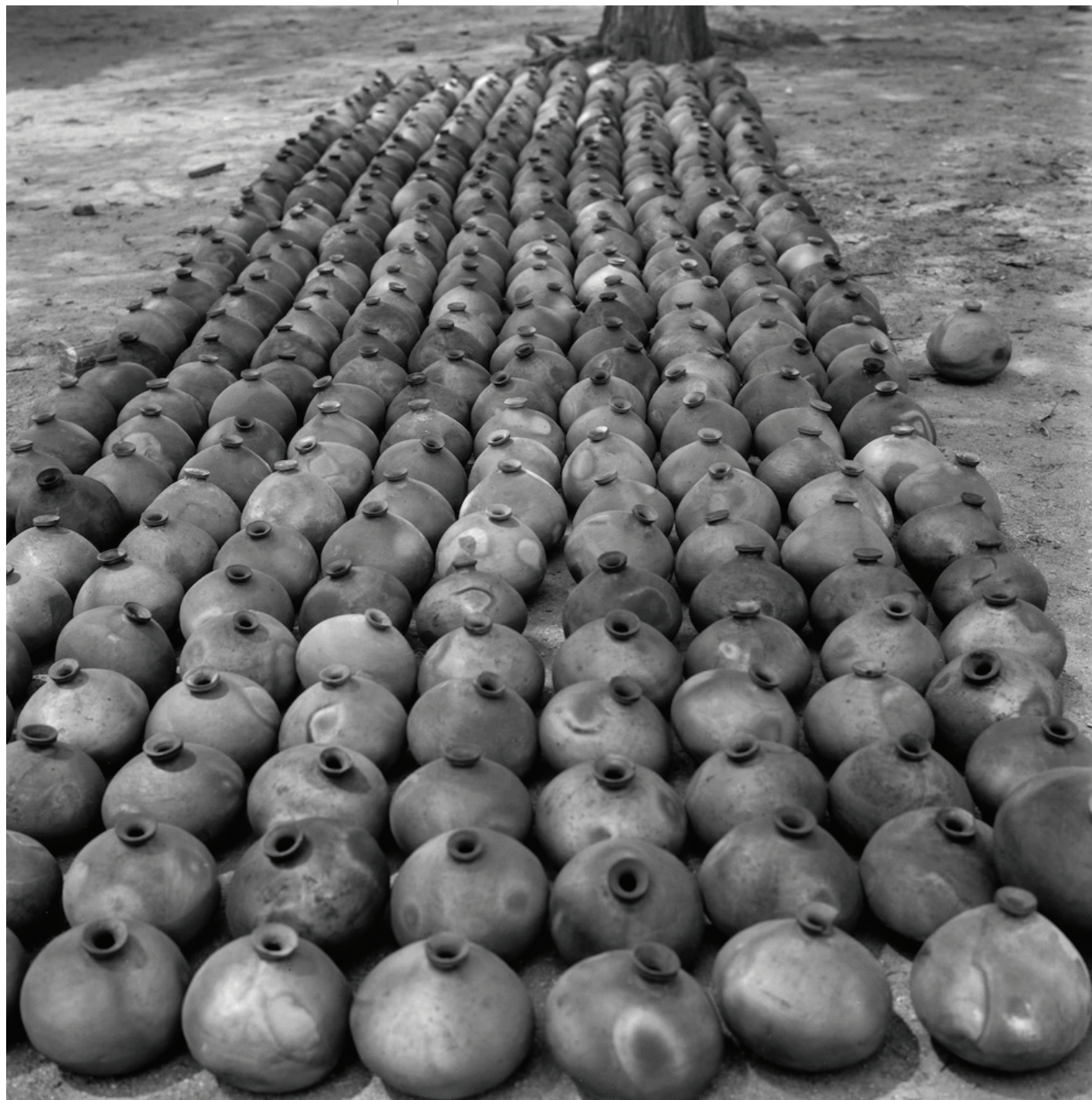
Ruth D. Lechuga Conjunto de cántaros Cántaros al sol Oaxaca 1971 Digitalización de negativo monocromático plata-gelatina 120 mm Acervo Fotográfico Ruth D. Lechuga, Fundación Ajaraca A.C.