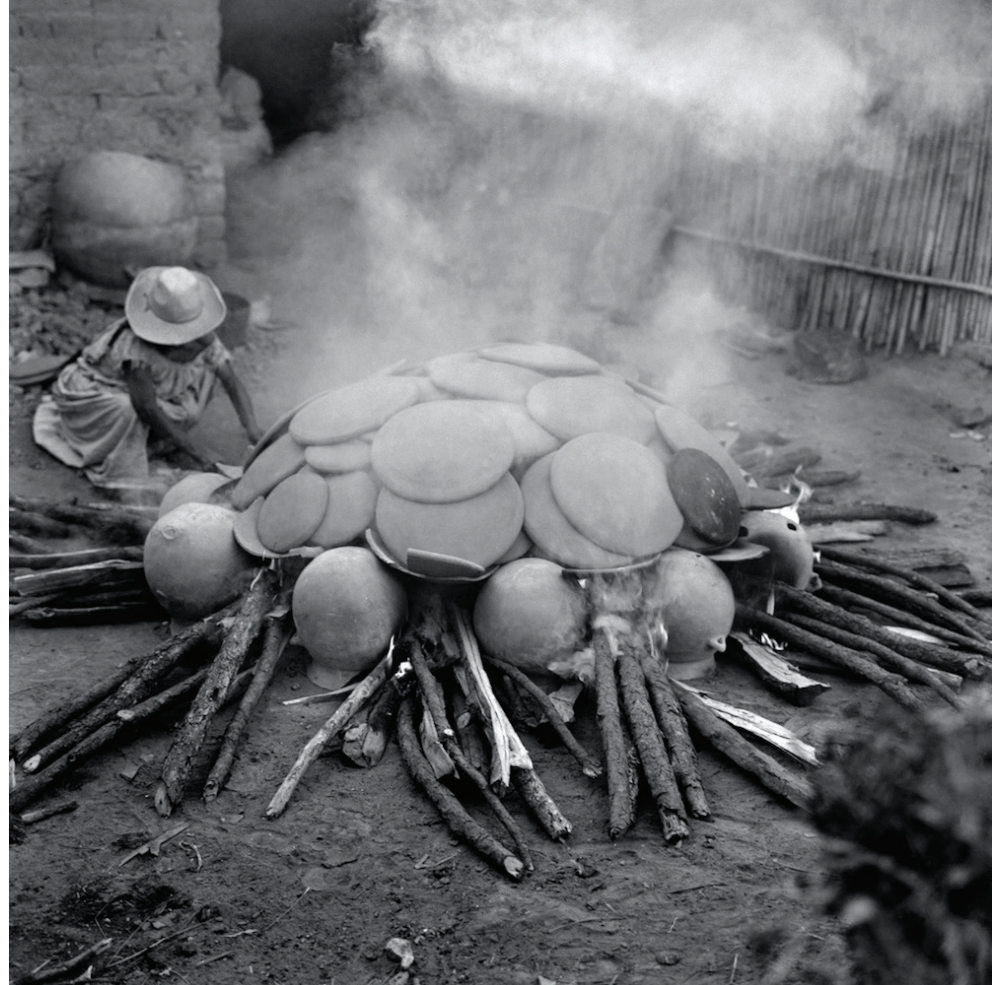
Ruth D. Lechuga Quema a cielo abierto Quema de piezas de barro a cielo abierto. La leña y el fuego están al cuidado de una mujer, en una comunidad cercana a Oapan, Guerrero 1975 Digitalización de negativo monocromático plata-gelatina 120 mm

Aunque inabarcable, el calendario festivo de México guió cientos de visitas de Ruth por el territorio mexicano. Rituales de cosecha, cambios de autoridades tradicionales, carnavales, Semana Santa o Día de Muertos, son imágenes de especial riqueza que nos permiten adentrarnos en momentos de la vida ritual de las comunidades y en la materialidad de las fiestas –la indumentaria, las flores, las máscaras, los objetos o los instrumentos musicales, entre otros–. A este conjunto también pertenecen imágenes de la creación artesanal de mujeres y hombres, un interés que Ruth alimentó mediante su colección de arte popular resguardada en el Centro de Estudios de Arte Popular que lleva su nombre, y en su trabajo de promoción de las técnicas tradicionales en el Museo de Artes e Industrias Populares. Profundizar acerca de las necesidades, los contextos de trabajo y los retos de creación artesanal de comunidades indígenas y mestizas, dio como origen un amplio y valioso registro fotográfico integrado a su acervo.