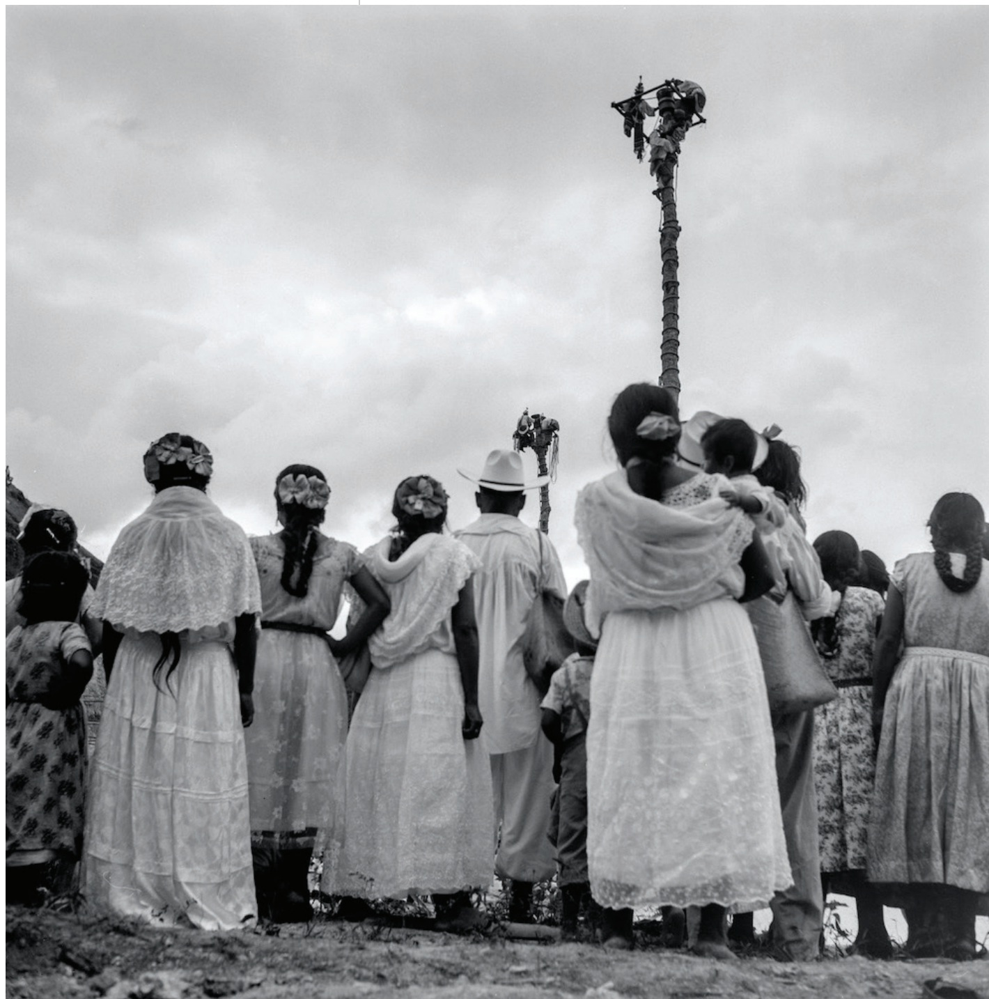
Ruth D. Lechuga Mujeres totonacas Mujeres con indumentaria tradicional totonaca y algunas con vestidos de telas industriales, observan el ritual de dos conjuntos de voladores en Papantla de Olarte, Veracruz ca. 1957 Digitalización de negativo monocromático plata-gelatina 120 mm Acervo Fotográfico Ruth D. Lechuga, Fundación Ajaraca A.C.