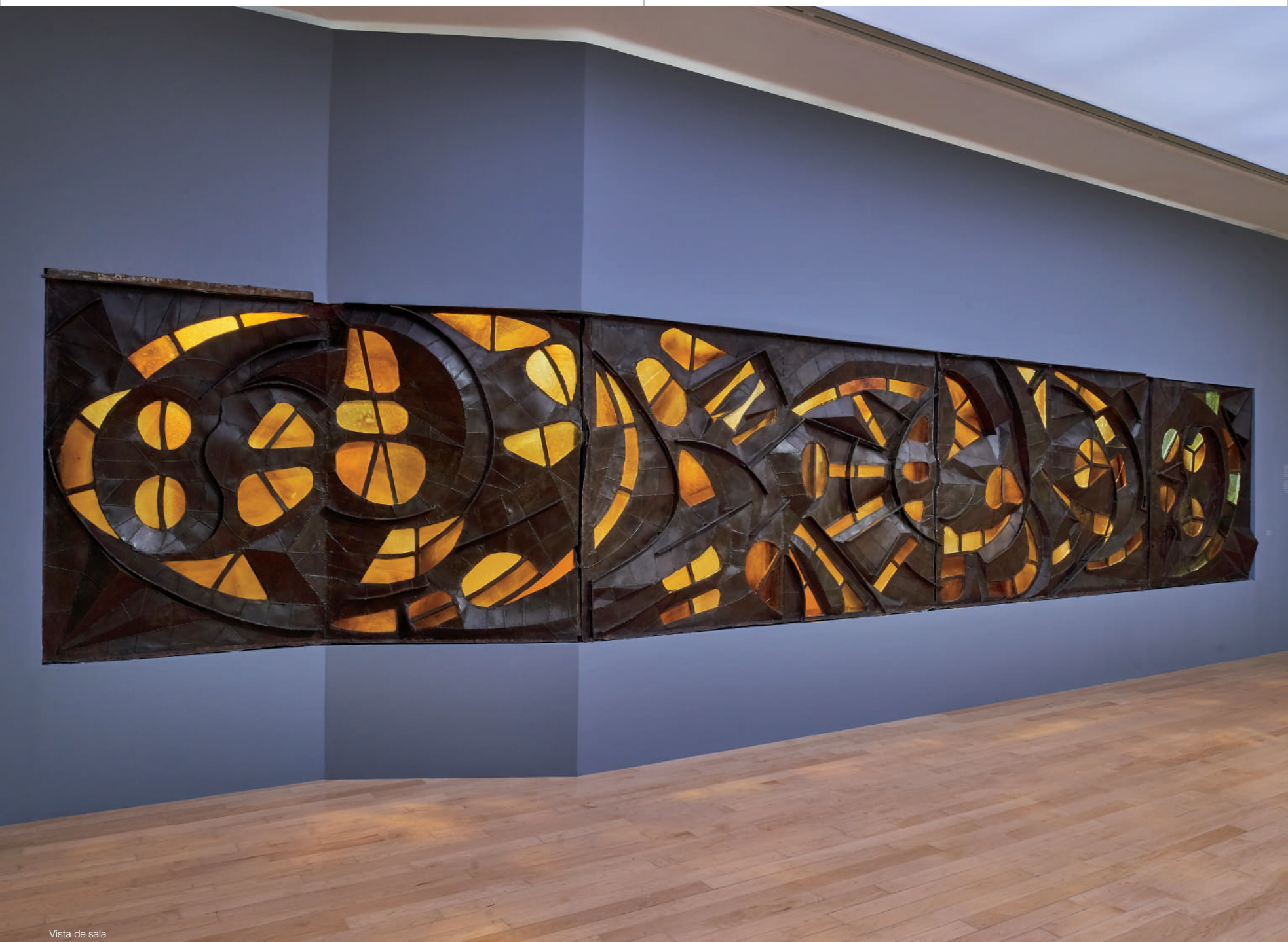
Vista de sala