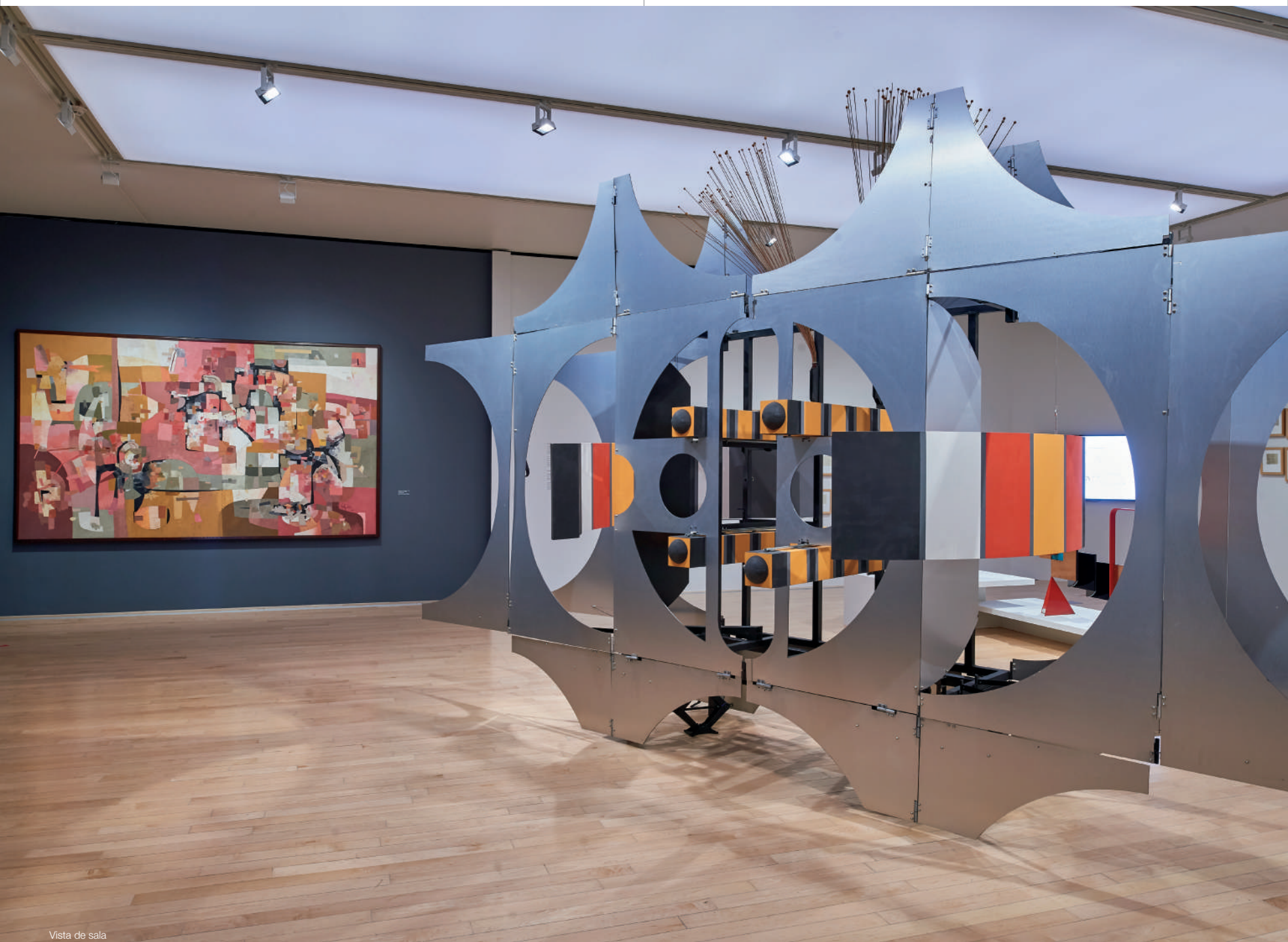
Vista de sala