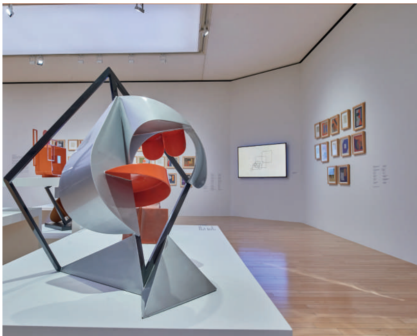
Espirales sin referencia , 1989 Referenceless Spiral Hierro policromado Colección MUJAC (DIGAV-UNAM). Donación del artista, 2018