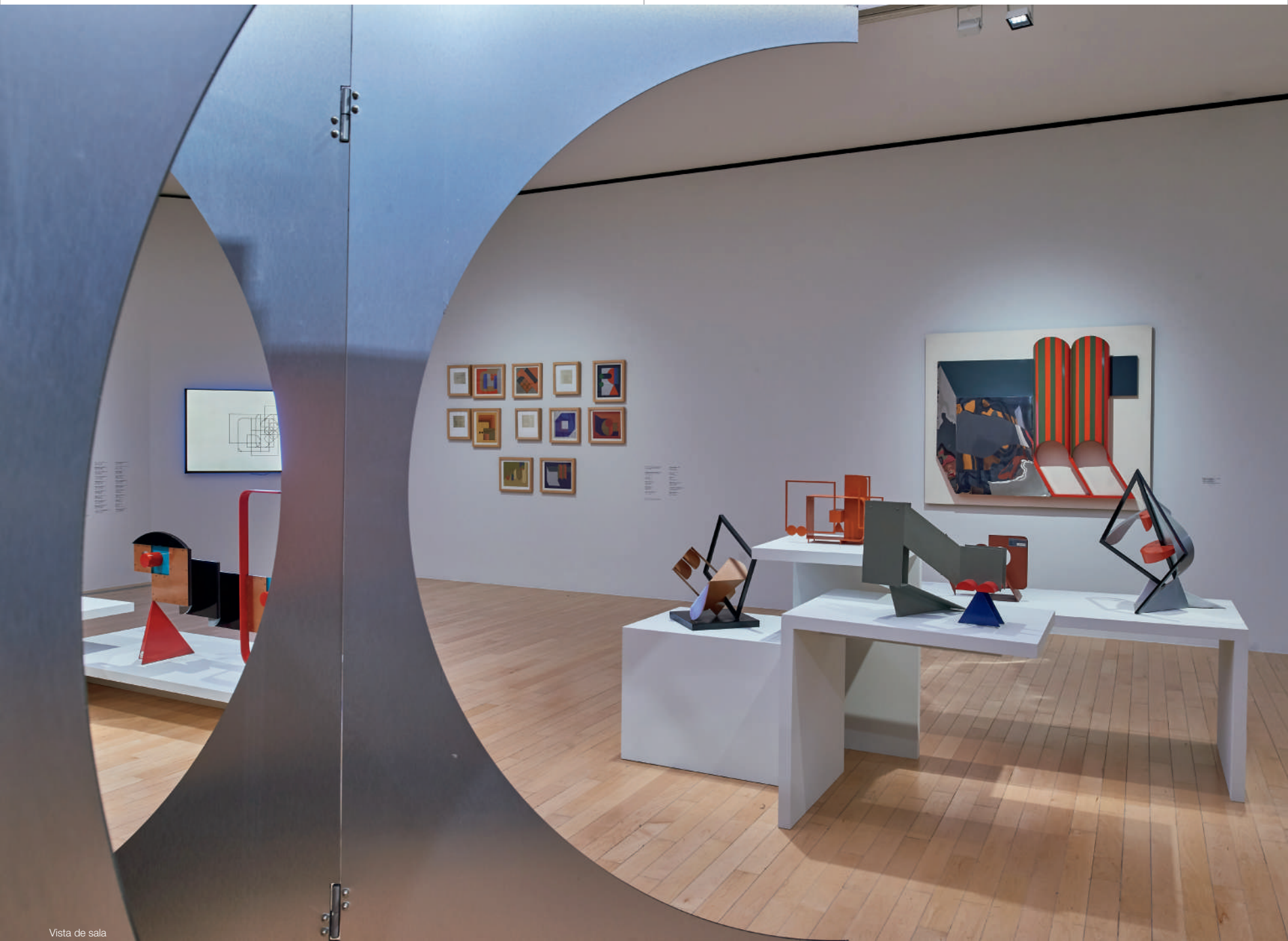
Vista de sala