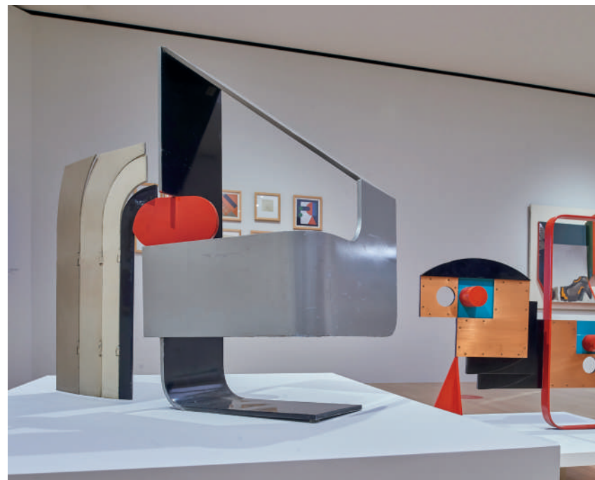
Origen de la reducción, 1977 Origin of the Reduction Metal policromado Colección Academia de Artes