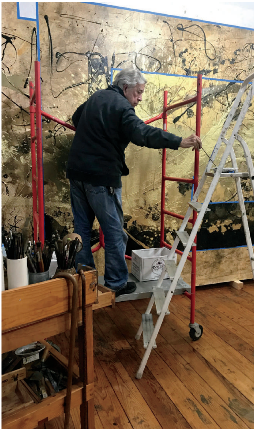
Archivo Manuel Felguérez