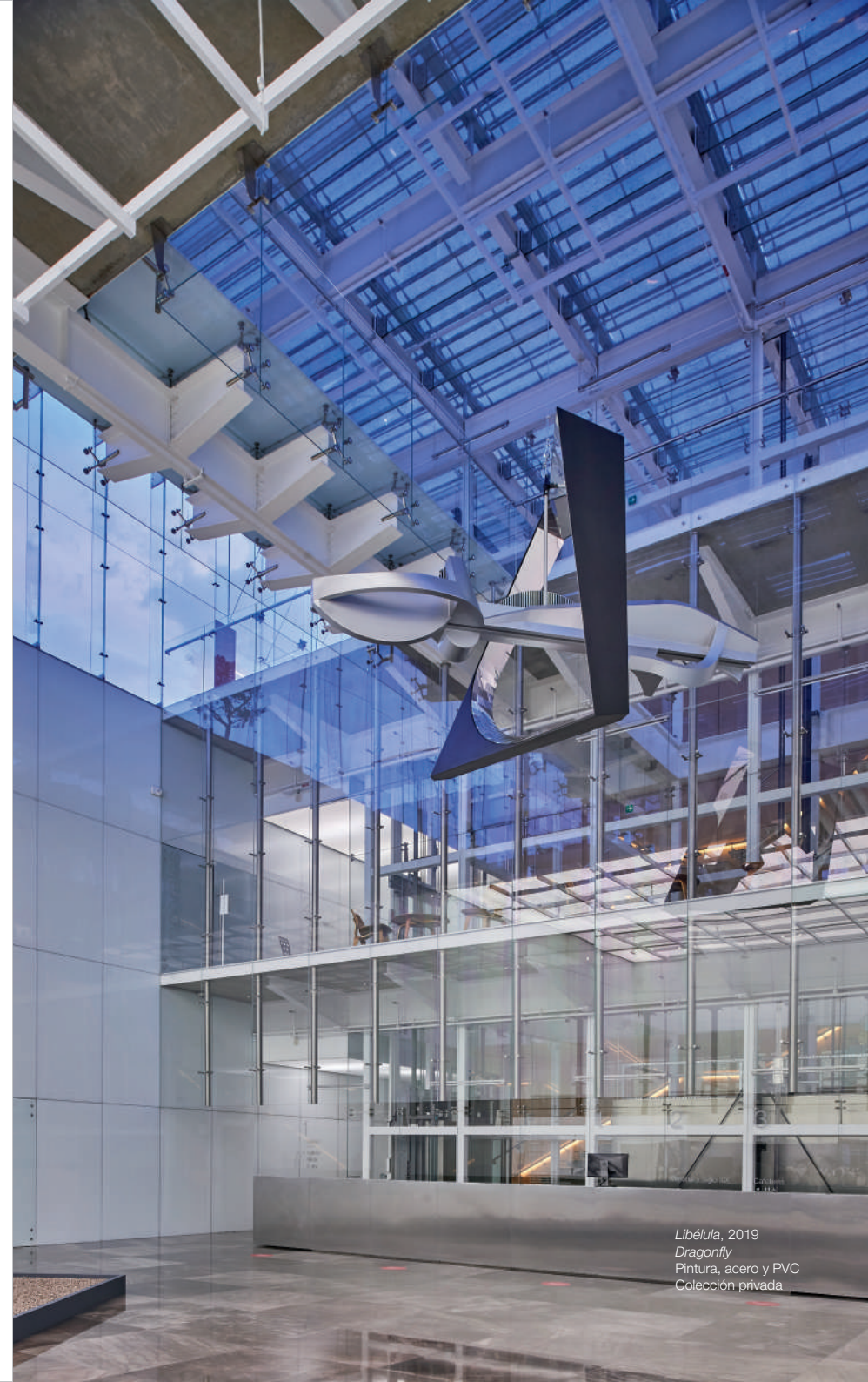
Libélula , 2019 Dragonfly Pintura, acero y PVC Colección privada

El montar Muro de las formas mecánicas y Libélula en el Vestíbulo del Museo Amparo tiene como propósito mostrar en un mismo espacio una etapa temprana y la última en el trabajo de Manuel Felguérez, y revelar la consonancia que existe en su práctica escultórica de distintos momentos.