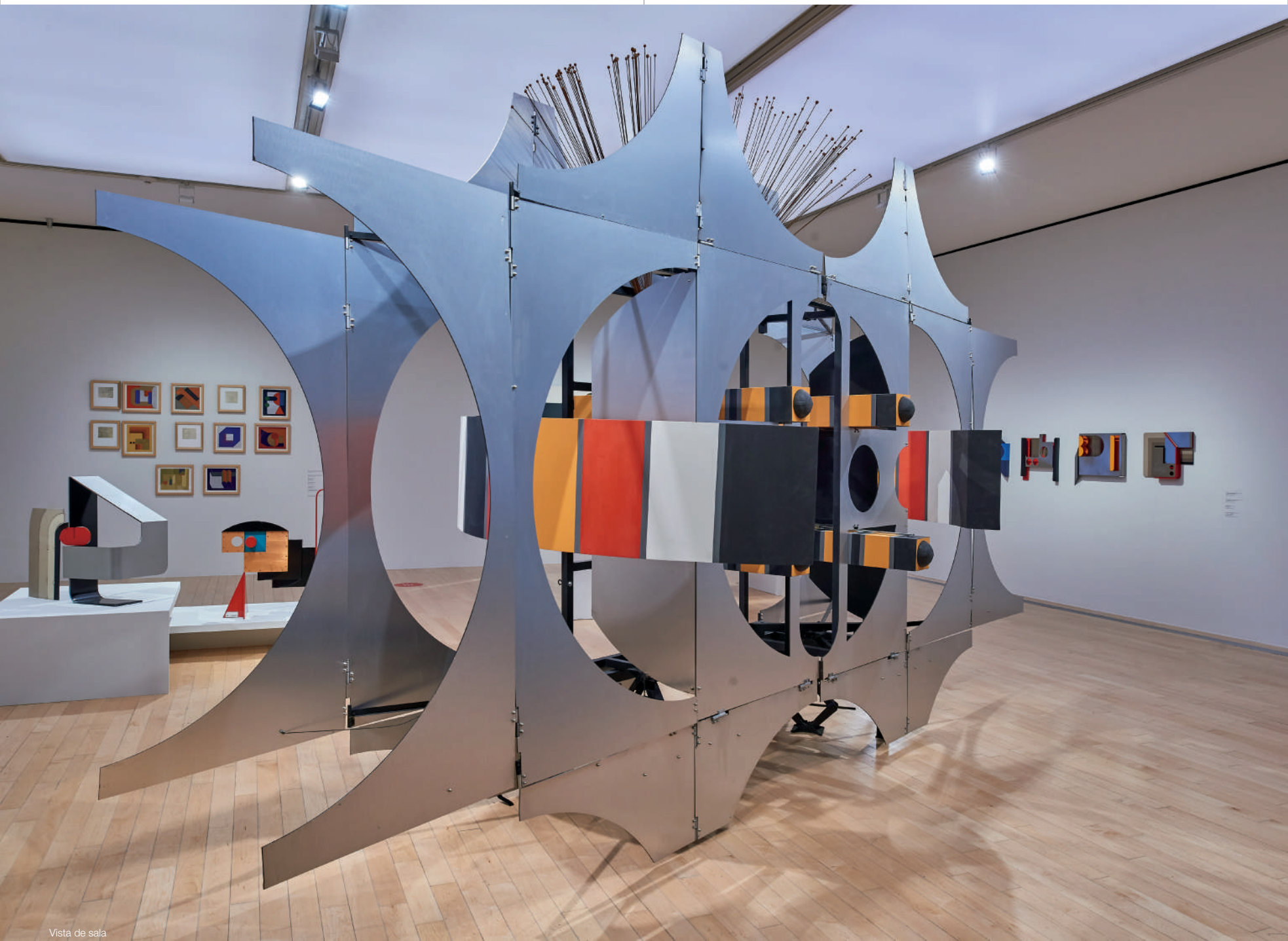
Vista de sala