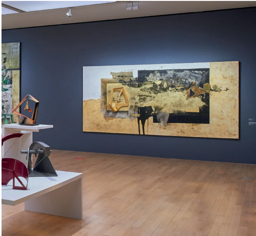
Me dijo Meche , 2018 Meche told me Óleo, acrílico y PVC sobre tela Colección privada

El título hace referencia y conmemora la agenda de la ONU para el desarrollo rumbo al año 2030, en la que se propone eliminar la pobreza extrema en 12 años. El hecho de utilizar un lenguaje abstracto en este contexto, defiende la idea de no representar a ninguna región específica. Ideológicamente, comenta Felguérez, “mi enemistad ha sido contra el nacionalismo”.