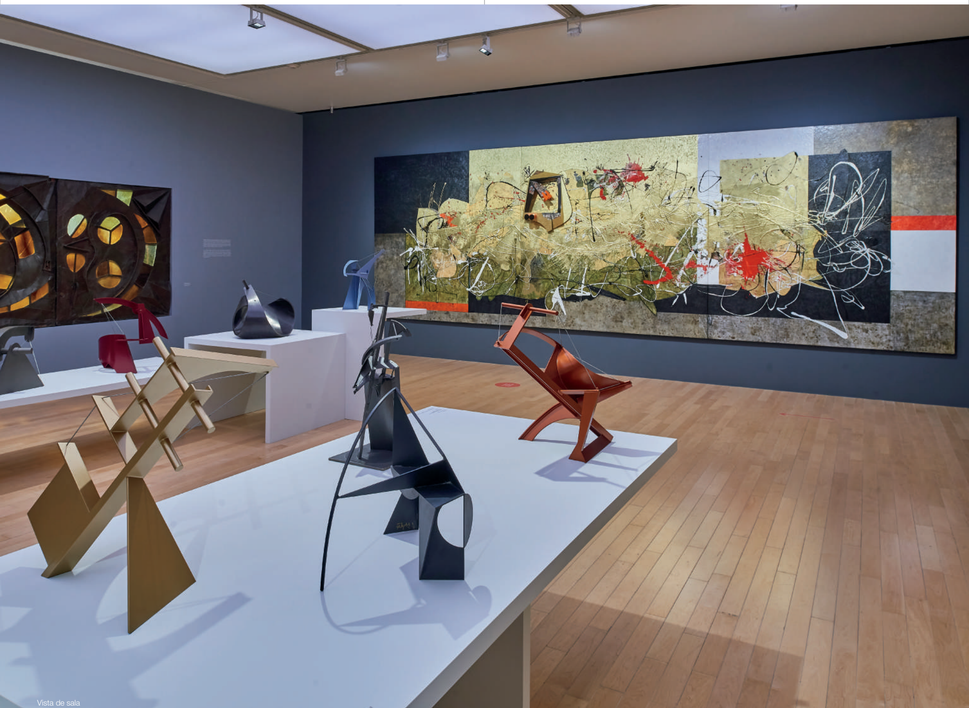
Vista de sala