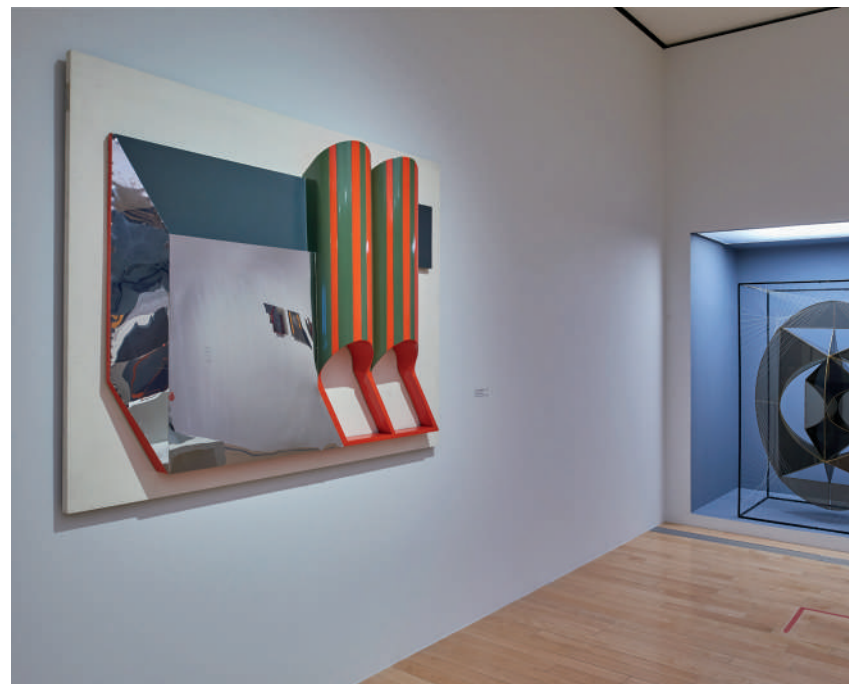
Fuga de cilindros , ca. 1976 Flight of Cylinders Metal policromado Colección Academia de Artes