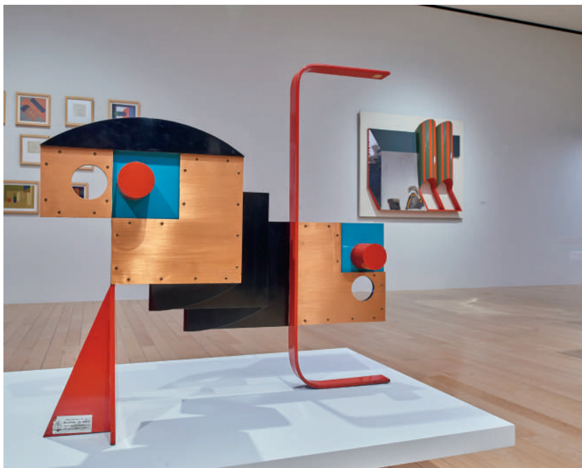
La energía del punto cero, 1977 Zero Point Energy Metal policromado y cobre Colección Academia de Artes