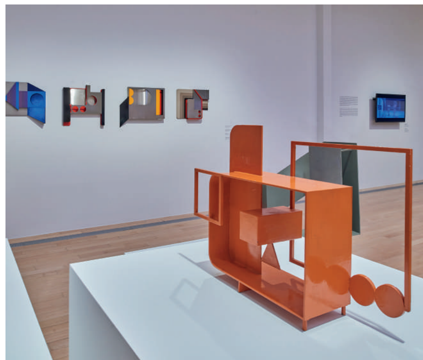
Interacción lineal, 1976 Linear Interaction Hierro policromado Colección MUAC (DIGAV-UNAM). Donación del artista, 2018