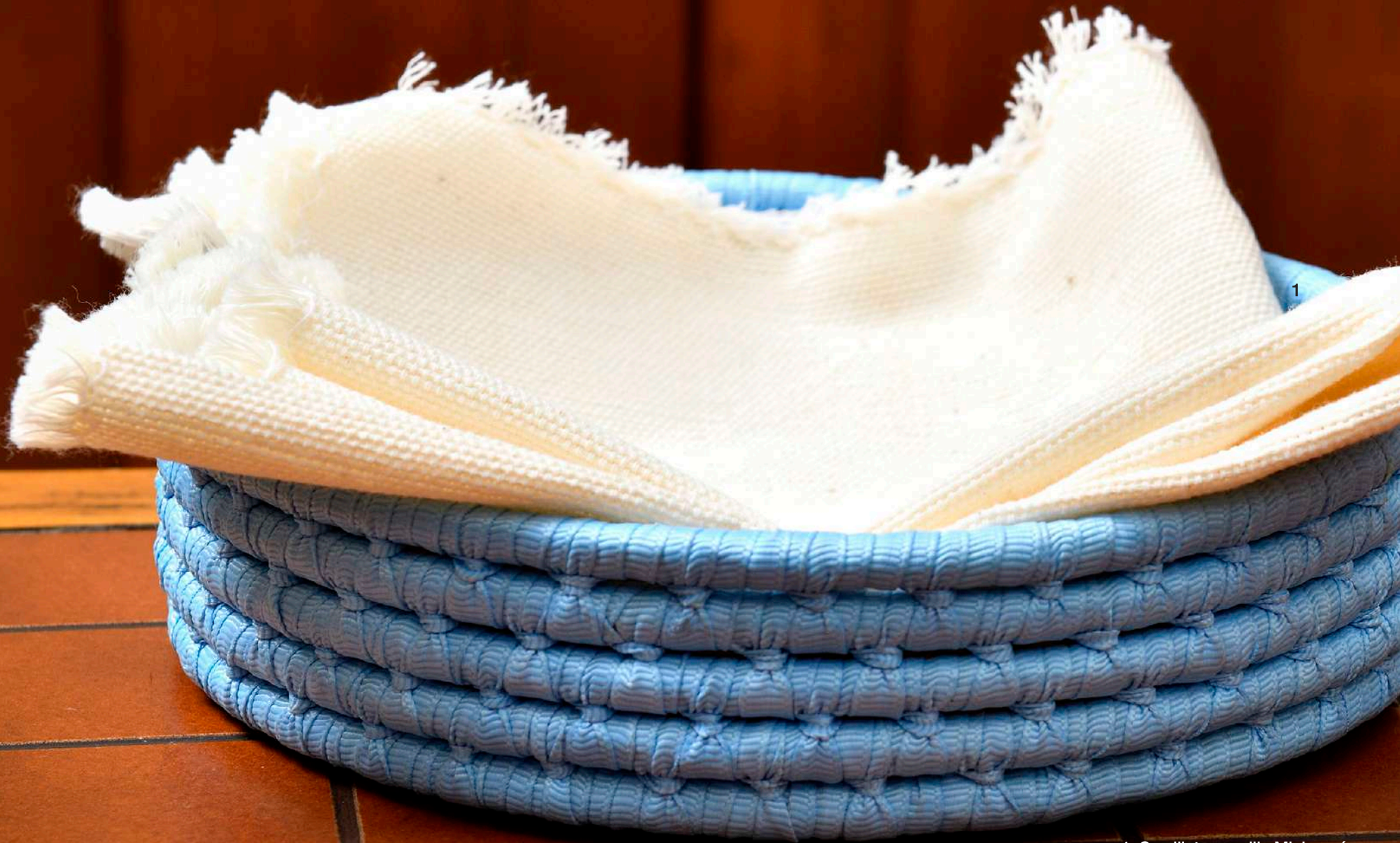
1. Servilleta sencilla Michoacán Hecha en telar de pedal, 100% algodón, elaborada por artesanas de Michoacán $122.00