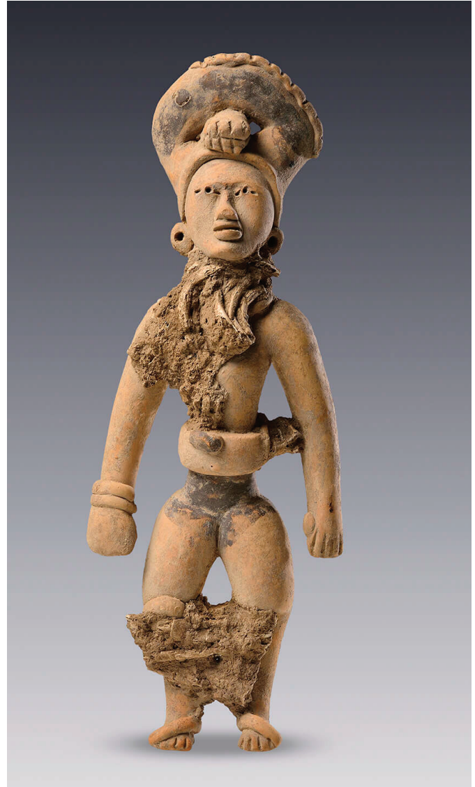
Jugadores de pelota. Huesteca. Norte de Veracruz o sur de Tamaulipas. Clásico tardío. Barro modelado, con decoración incisa y pintura